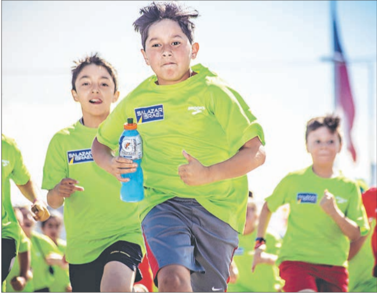
LOS NIÑOS CORREN se llevará a cabo en diciembre próximo.