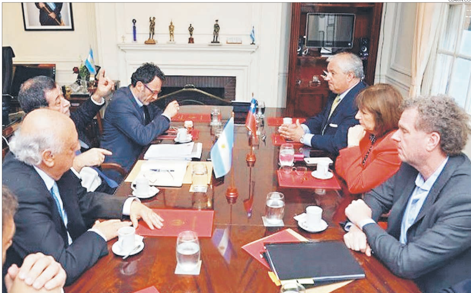
FUE SOLICITADA EN FORMA URGENTE POR CHILE

Cercanos a Aleuy, comentaron que en los momentos previos a la reunión con la autoridad trasandina, se enteró de la reunión que