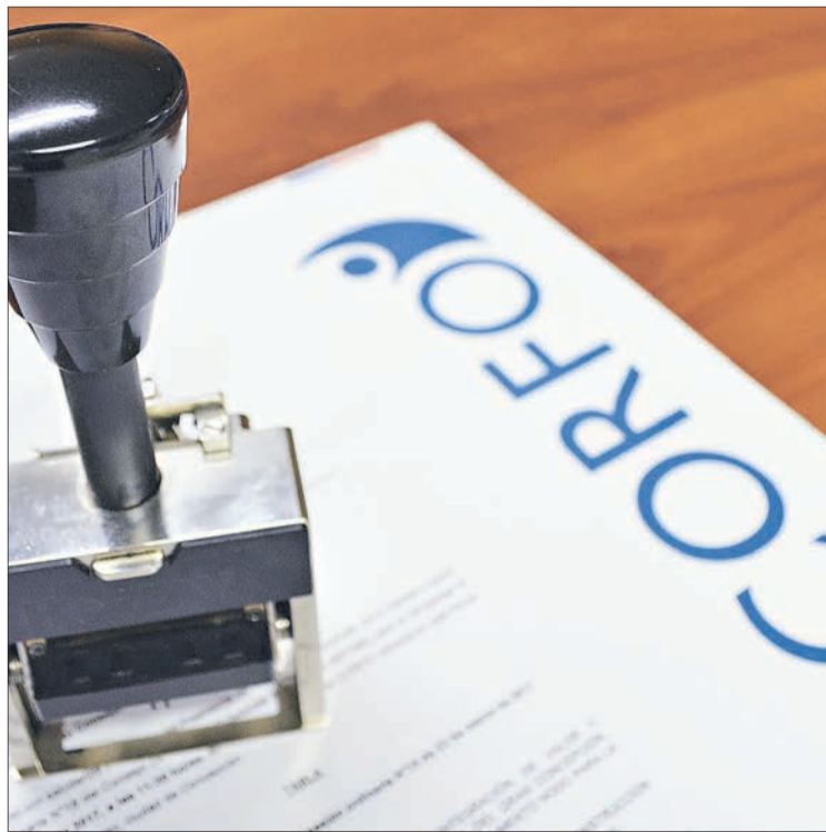
MISIVA FUE ENVIADA con copia al intendente del Bío Bío.