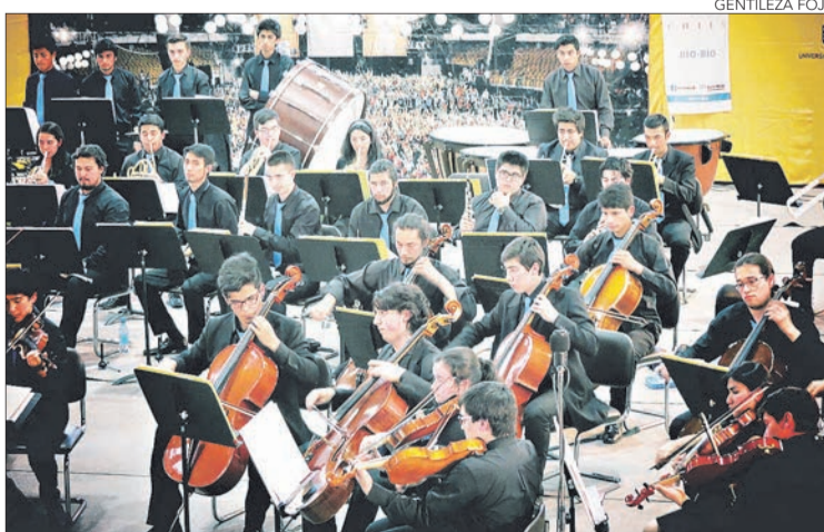
AGRUPACIÓN REGIONAL se presentará en Concepción, Tomé y San Carlos.

Twitter @DiarioConce contacto@diarioconcepcion.cl