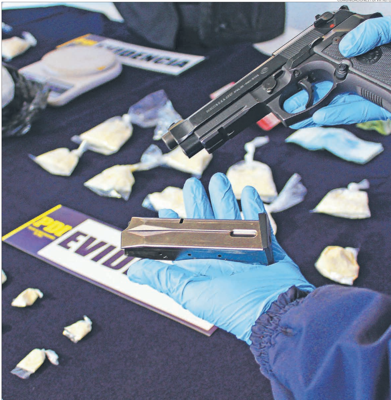
COMUNICACIONES PDI VIII REPOL

Ayer se inició el reentrenamiento de 100 detectives de las regiones de Bío Bío y Araucanía. El objetivo es erradicar la venta de drogas de los barrios y mejorar la sensación de seguridad de la ciudadanía.