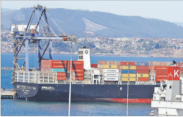
EL CABOTAJE fue el único servicio que presentó retrocesos en 12 meses.