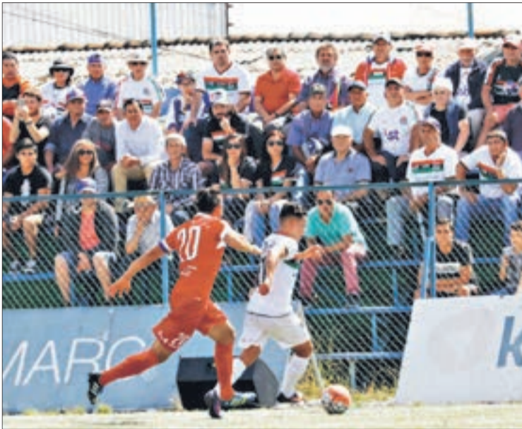
EL BERNARDINO Luna nuevamente está en el centro de la polémica, tras los incidentes ocurridos en el Lota Schwager vs Vallenar.

Twitter @DiarioConce contacto@diarioconcepcion.cl