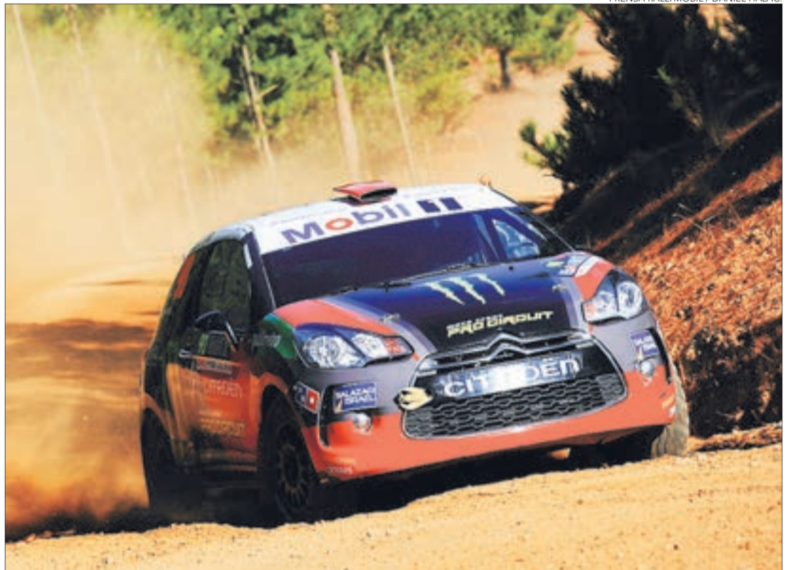
BENJAMÍN ISRAEL consiguió su segundo triunfo consecutivo en la fecha que se disputa en la localidad de la Sexta Región.

Con una gran jornada dominical, Benjamín Israel repitió su triunfo en el RallyMobil de Pichilemu, al quedarse con la victoria en la serie R3 en la fecha inaugural de la temporada 2017 de la cita tuerca más importante del país.