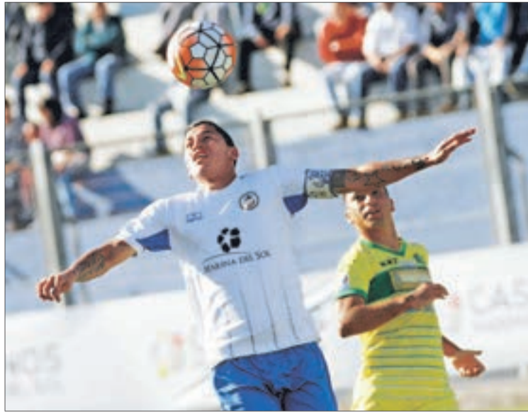
EL "BAMBINO" llegó a 14 goles en la temporada con la camiseta de Naval.