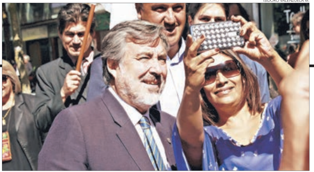
OBTUVO 67 VOTOS de los 111 miembros que conforman el comité.

Twitter @DiarioConce contacto@diarioconcepcion.cl