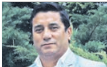
Cristián Campos, diputado PPD del Distrito 43.

“Debemos hacer prevalecer la unidad y la diversidad que existe en el conglomerado”.