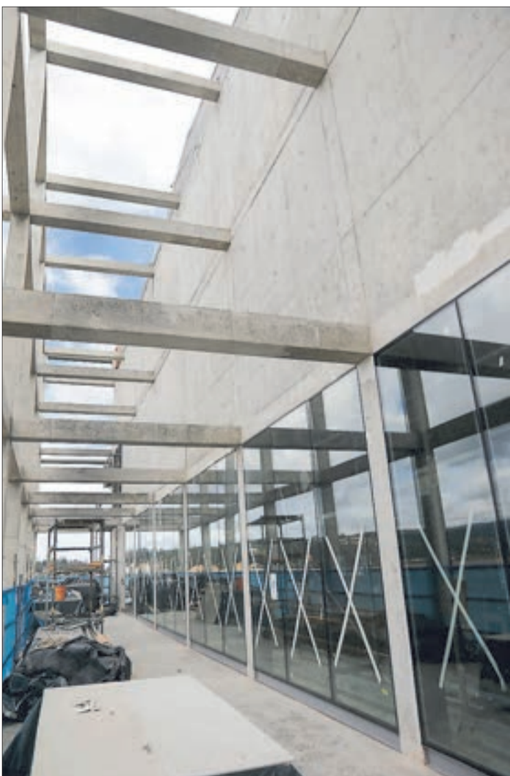
ESTA ES UNA DE LAS PASADAS que tiene el Teatro Regional en su segundo nivel y que mira hacia la comuna de Chiguayante.

Twitter @DiarioConce contacto@diarioconcepcion.cl