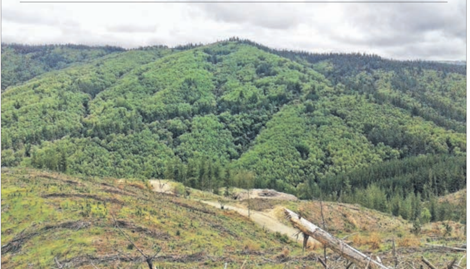
ÁREA de Alto Valor de Conservación Bosque Maulino Ruiles y Pitaos de Quivolgo al Norte del río Maule. Se quemó en un 98%. Se inicia el proceso de reforestación.

Especial énfasis en: asociatividad y participación con la comunidad en la llamada zona de interfaz , estudios de nuevas formas de plantar y en la recuperación de zonas de Alto Valor de Conservación.