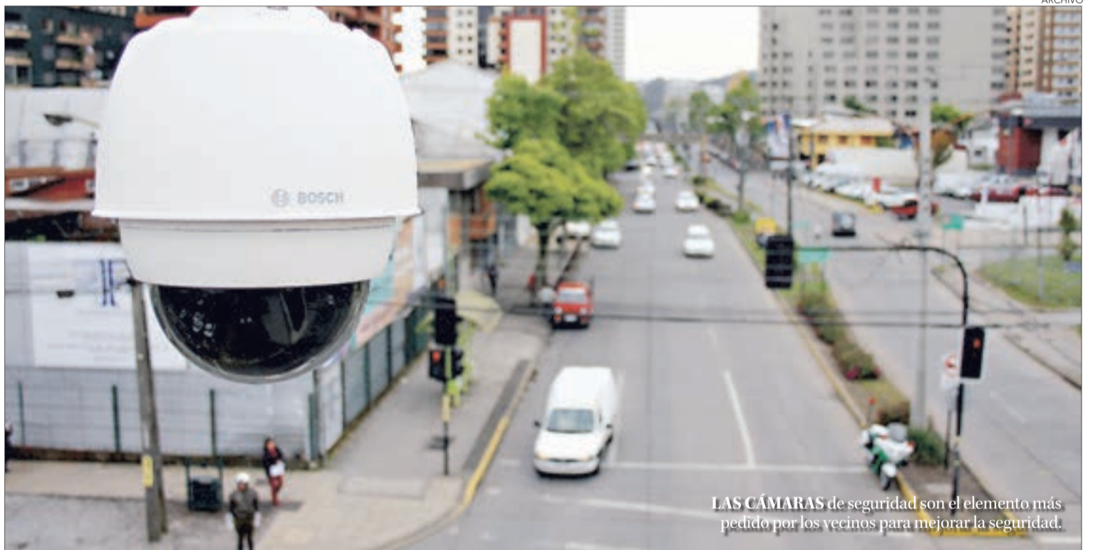
LAS CÁMARAS de seguridad son el elemento más pedido por los vecinos para mejorar la seguridad.

Concepción, Talcahuano, San Pedro, Chiguayante y Hualpén detallaron sus prioridades contra la delincuencia para este año.