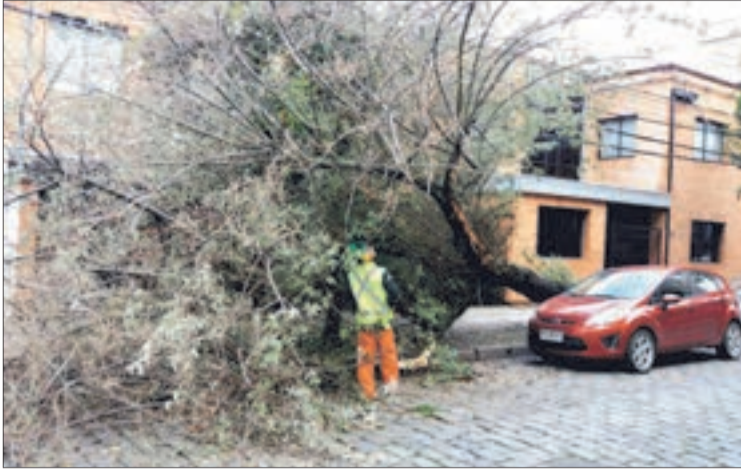
EL MUNICIPIO penquista trabajó en retirar los árboles caídos.