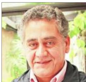
Raúl Súnico, ex diputado y ex subsecretario de Pesca.