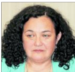
Clemira Pacheco, diputada.