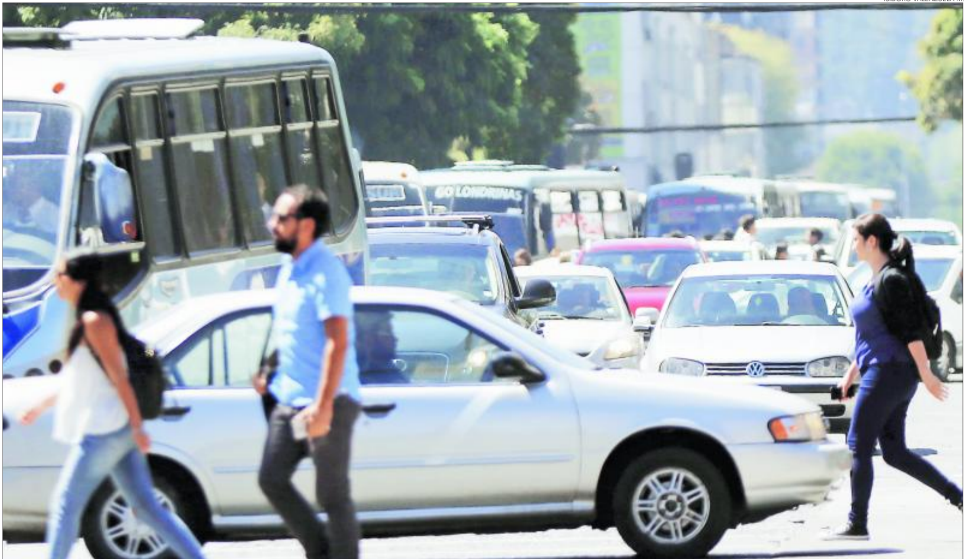
ISIDORO VALENZUELA M.

“El 99,9% de los establecimientos escolares comenzó las clases en la Región”. Sergio Camus , seremi de Educación.