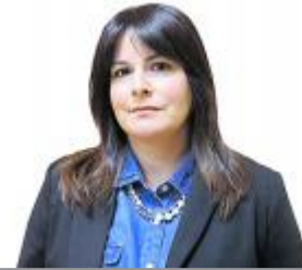
Por Lorena Bustos Reinoso Académica de Ingeniería Comercial Universidad San Sebastián