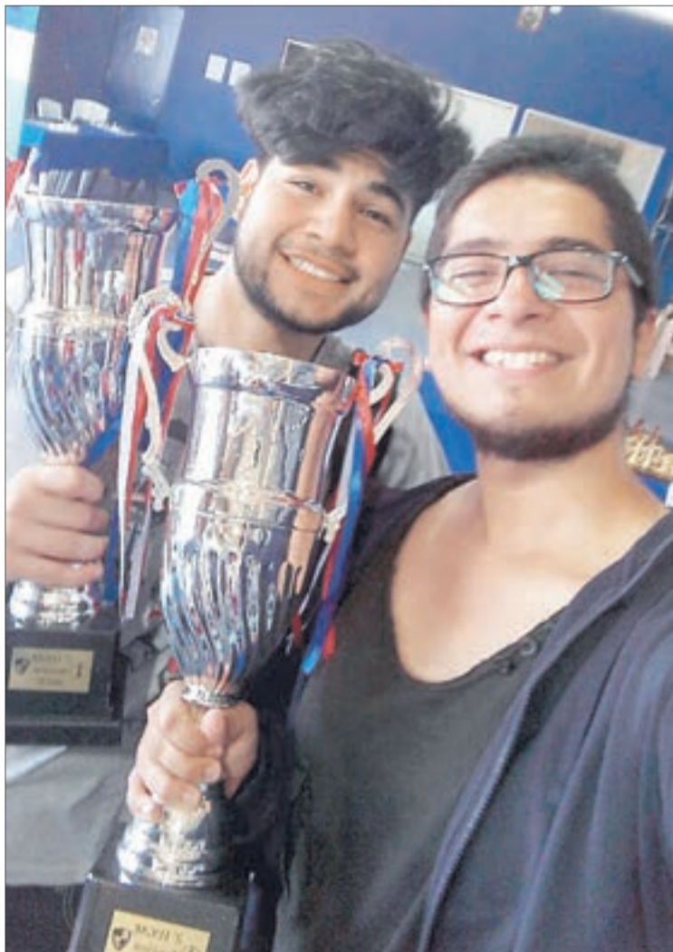
Su último trofeo como juvenil, a la derecha con la copa de vicecampeón nacional Sub 20.

que entrenaban todo el año pero disfrutaban ganar, no jugar. Creo que eso es lo importante, que siempre me he dedicado a disfrutar del juego, especialmente en esta última etapa: los viajes, los amigos, los buenos momen-