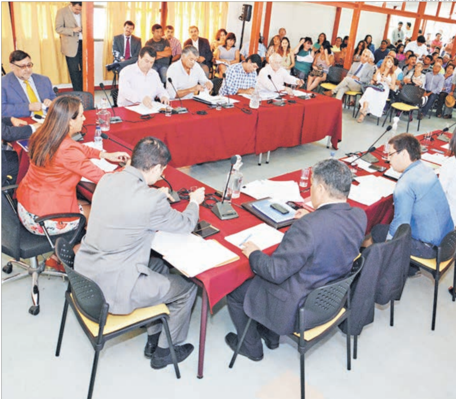
MUNICIPALIDAD DE HUALPEN