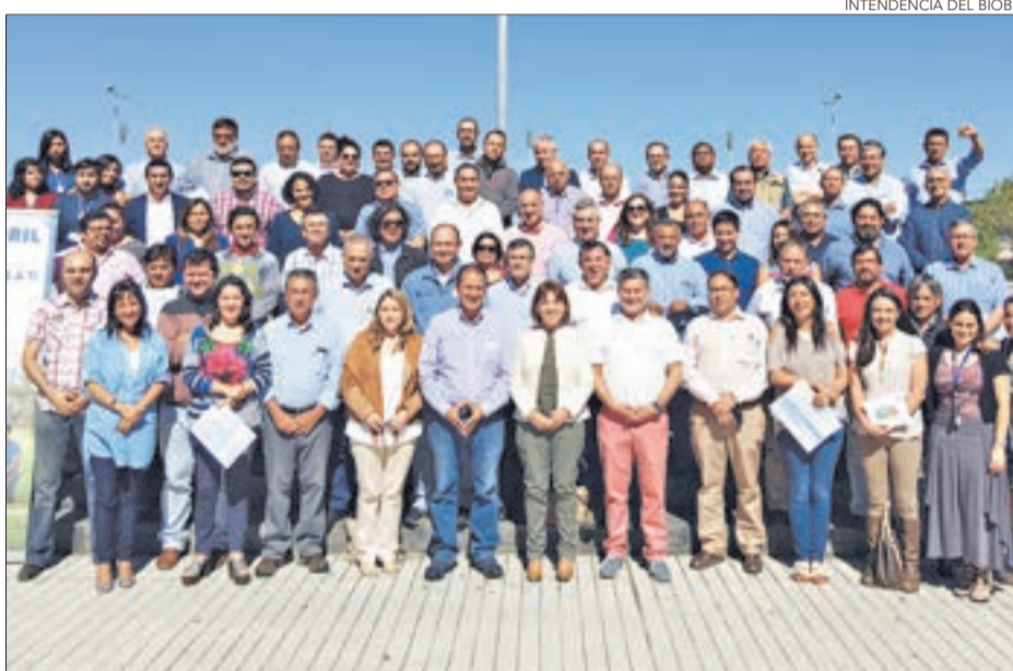
AUTORIDADES del Bío Bío se reunieron el fin de semana para habilitarse como censistas.

Censo es el mayor operativo estadístico que se realiza en un país, porque la información que se levanta es trascendental para la elaboración de futuras políticas públicas, programas de apoyo a quienes más lo necesitan y para las decisiones en el ámbito privado.