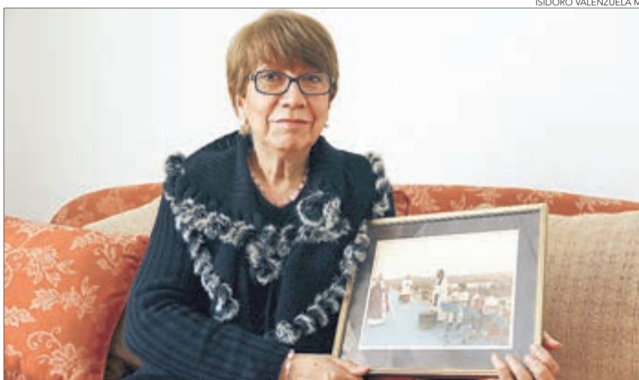
LA PROFESORA y directora de coro trabajó un año en preparar su participación en la misa.

Toda esta pompa para recibir, sin embargo, a un hombre que la profesora jubilada recuerda como extremadamente sencillo. "Pensé que iba a ser una figura muy sofisticada y era un hombre coloradito, con dientes imperfectos y con zapatos café sin lustre, muy sencillo, muy cercano, pero a la vez con una cosa muy especial, una mirada llena