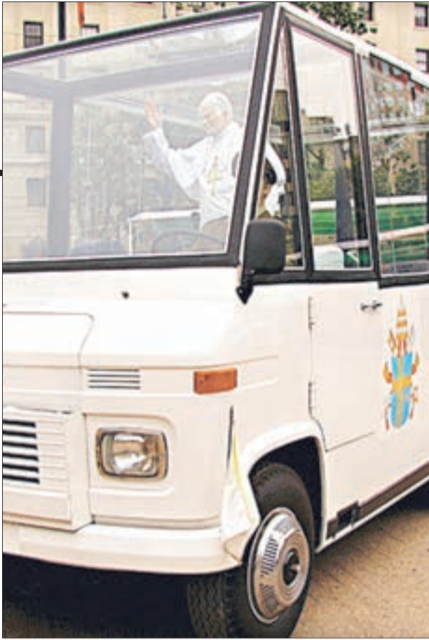
EL MÍTICO “papamóvil” en que se desplazaba el Papa, permitió que miles de penquistas lo vieran pasar y lo saludaran.