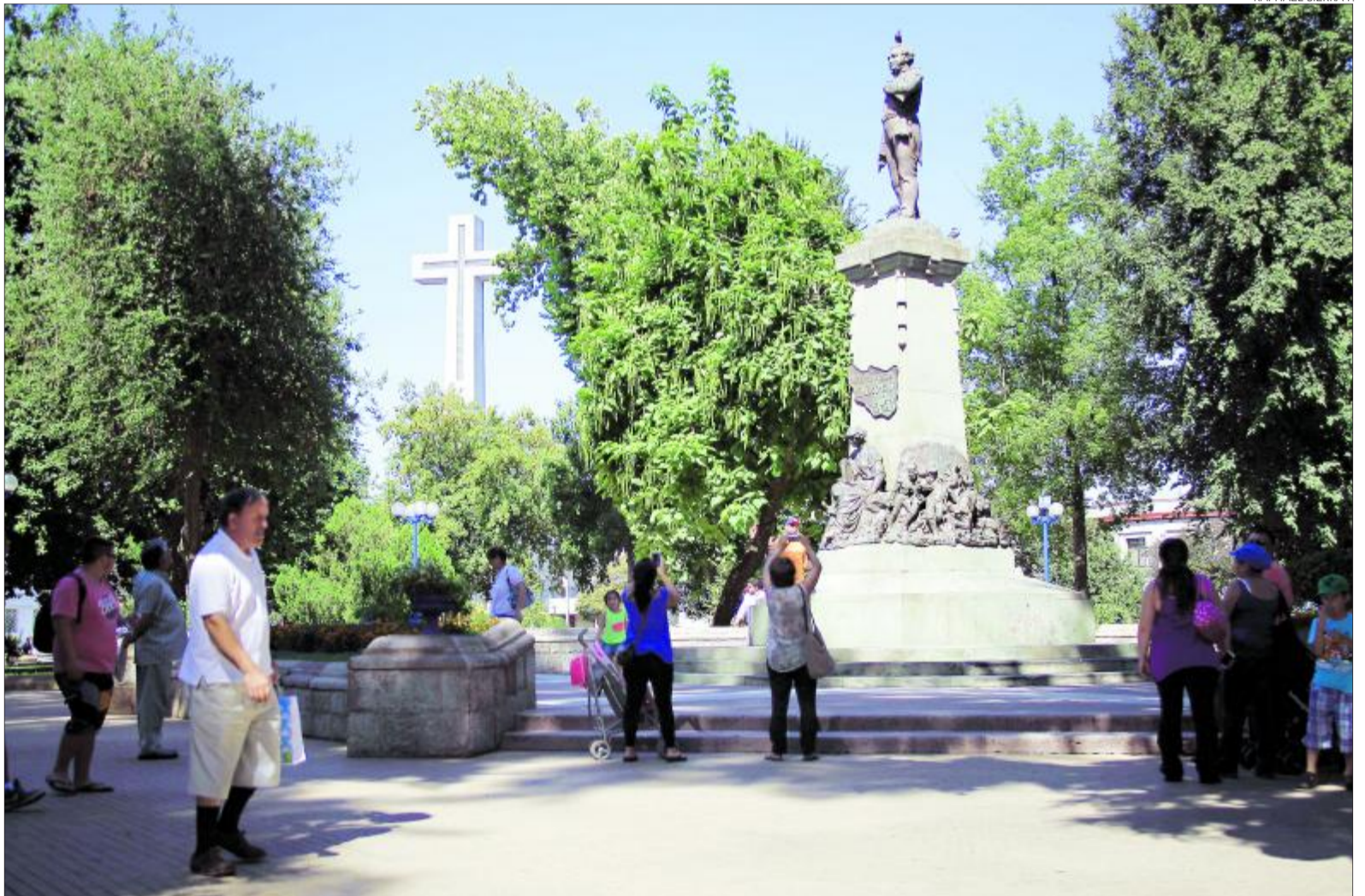
RAPHAEL SIERRA P

El Ejecutivo no incluyó la iniciativa entre las materias que deben ser aprobadas durante marzo, principalmente debido a que la agenda debió ser modificada por los incendios forestales que afectaron al país.