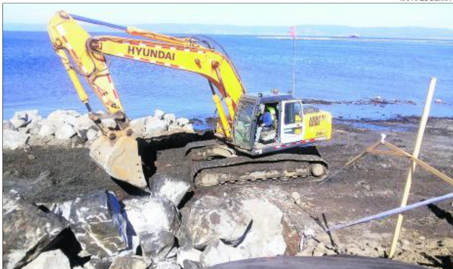
FOTOGRAFÍA TOMADA el 6 de diciembre cuando realizaban excavaciones del terreno.