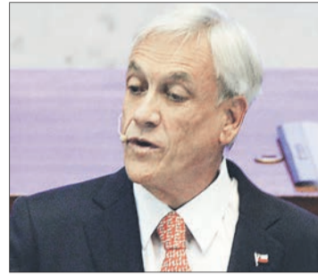
José Antonio Kast, candidato presidencial independiente.

"Haber participado en el gobierno militar no es un pecado. Si haber tenido poder para evitar atropellos (y no haberlo hecho)".