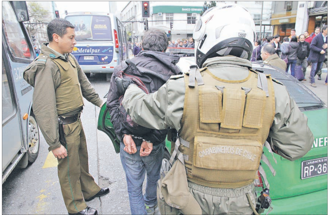
LAS POLICÍAS trabajan en reducir las cifras de delitos.

ridad Ciudadana de Chiguayante, insistió en que los hechos de este mes fueron un hecho aislado, pero que los preocupa, pues no es algo común en la ciudad.