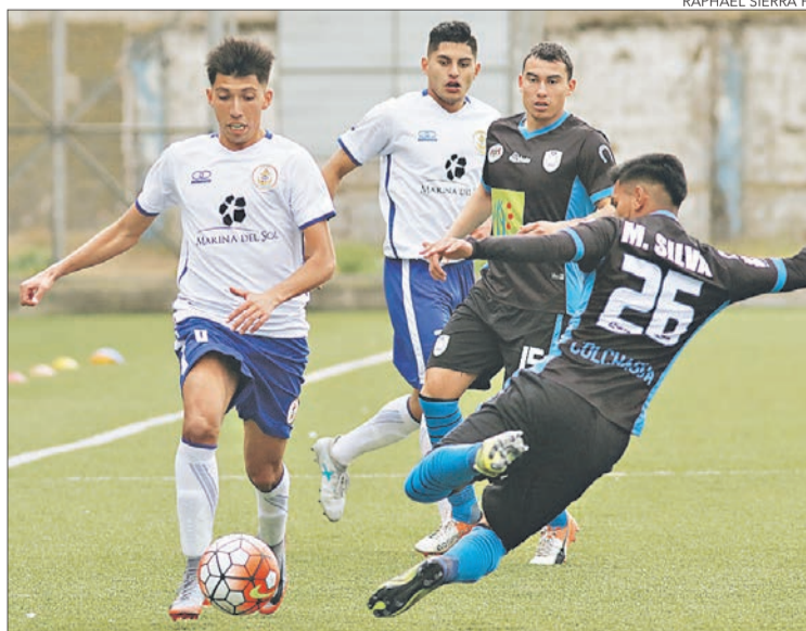
EN MELIPILLA Naval quiere seguir con la racha positiva.

Twitter @DiarioConce contacto@diarioconcepcion.cl