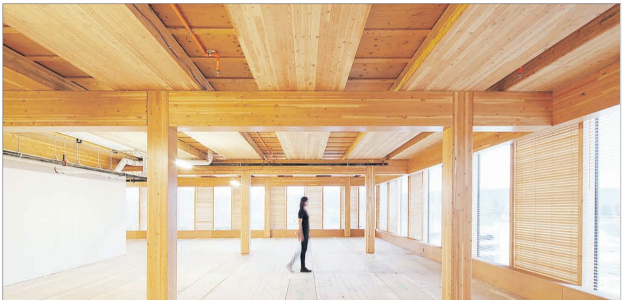
ESTE TIPO DE EDIFICACIONES es tendencia en Europa y América del Norte.