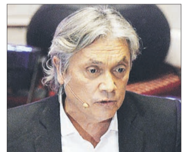
Eduardo Artés candidato presidencial de la Unión Patriótica.

"Las regiones tienen que resolver sus propias regiones (...). El Estado tiene que soltar las amarras".