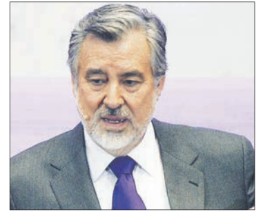
Sebastián Piñera, candidato presidencial de Chile Vamos.

"Hay excesivas facultades de los fiscales para cerrar causas sin investigar, 90%! Eso es impunidad".