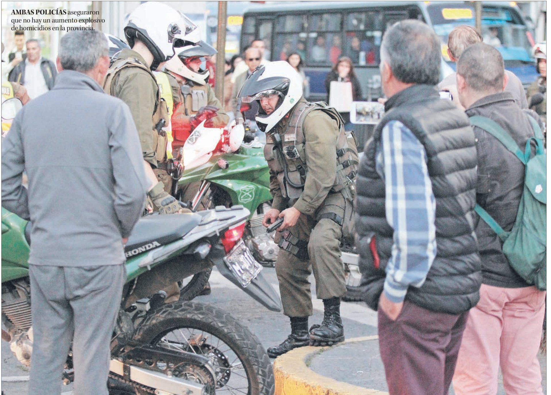
AMBAS POLICÍAS aseguraron que no hay un aumento explosivo de homicidios en la provincia.

INTELIGENCIA ES CLAVE PARA ENFRENTAR ESTOS DELITOS