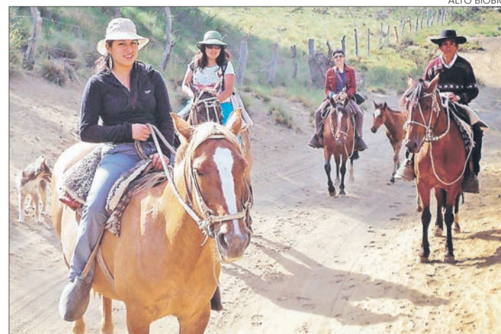
ALTO BÍO BÍO