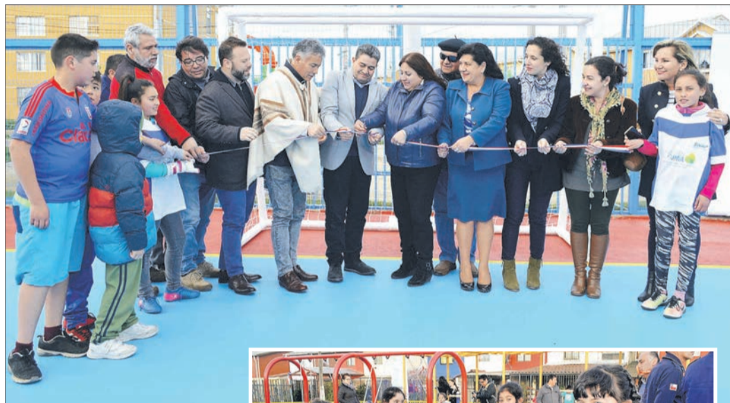
Ejecutivos de ENAP, presidentes de juntas de vecinos y autoridades municipales participaron en el tradicional corte de cinta.

El primero de ellos es el proyecto Mejoramiento de Multicancha y Plazoleta en Solar de Hualpén, que por un monto de más de 75 millones de pesos, consiste en la construcción de una gradería techada y el reforzamiento del cierre perimetral de dicho espacio deportivo.