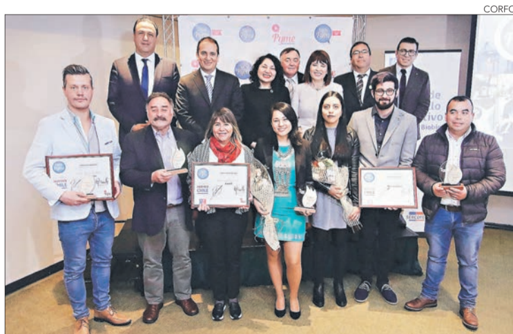
PREMIADOS en la Semana de la Pyme Región del Bío Bío.

Twitter @DiarioConce contacto@diarioconcepcion.cl