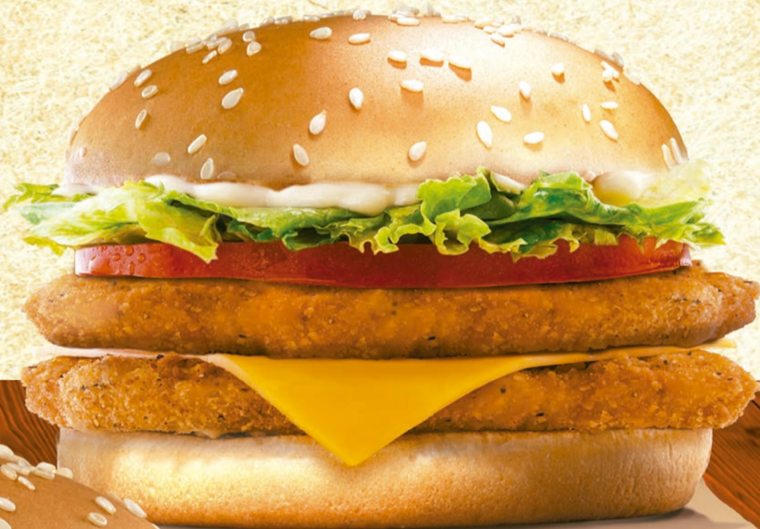
Pollo Jr Cheddar Doble