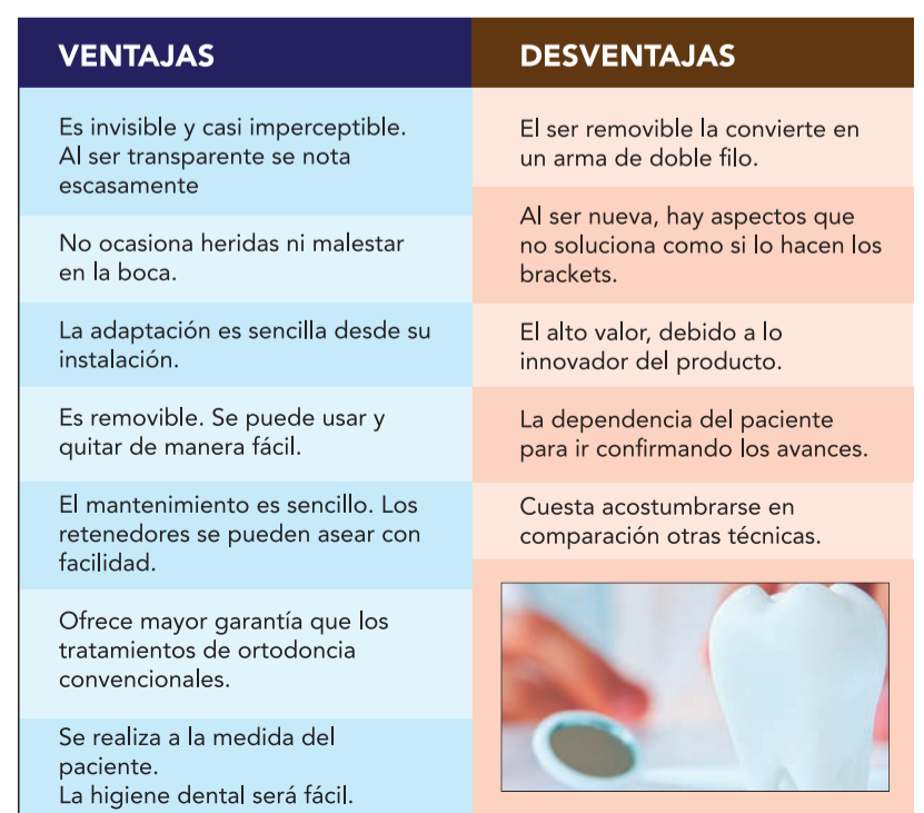
TABLA COMPARATIVA DE TÉCNICA INVISALIGN

Como se puede analizar en el recuadro, son más las ventajas que las desventajas de este innovador tratamiento de ortodoncia invisible. Sin embargo, se puede concluir que con el paso de los años, son cada vez más las personas que lo utilizan y el valor es cada vez más accesible. Solo hay que tener este modo de ortodoncia dentro de las opciones y decidirse a usarlo como el método que solucionará los problemas de estética dental.