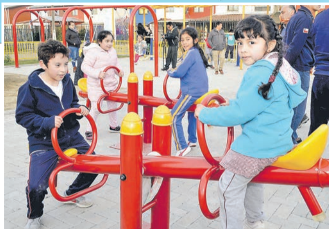
Los niños son los mayores beneficiados con estos proyectos.