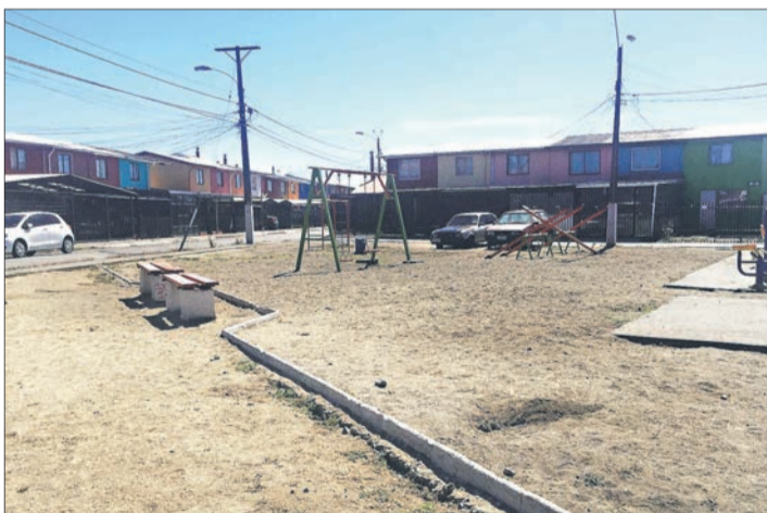
Proyecto población Patricio Aylwin, antes y después.