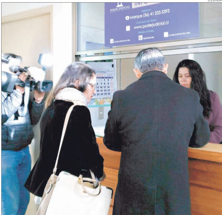
SE CITARÁ A tres personas a declarar.

La presentación de la querrela, que se realizó en el Juzgado de Garantía de Chiguayante, permitirá develar si el caso está relacionado con tráfico de