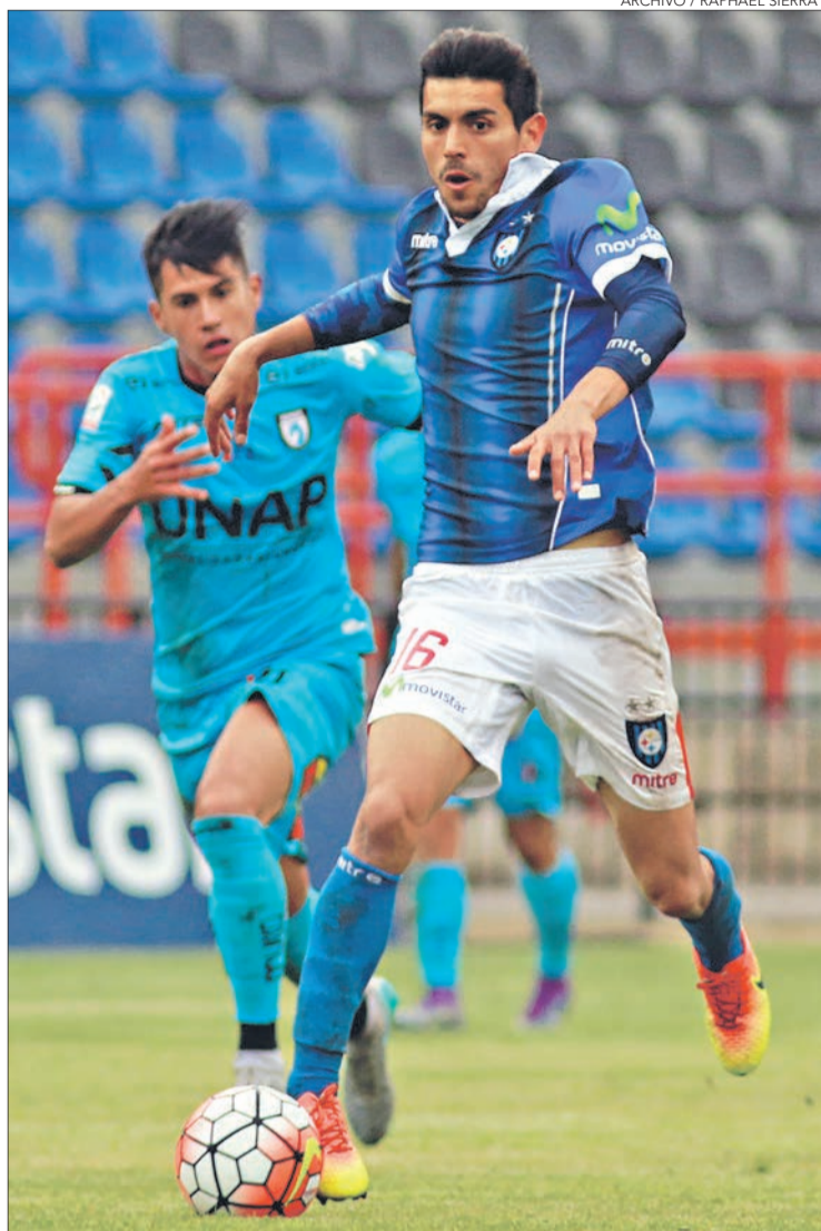
UNA MASIVA concurrencia de hinchas espera Huachipato para sus próximos tres encuentros como local.

Además, todos quienes adquieran su boleto este domingo, podrán