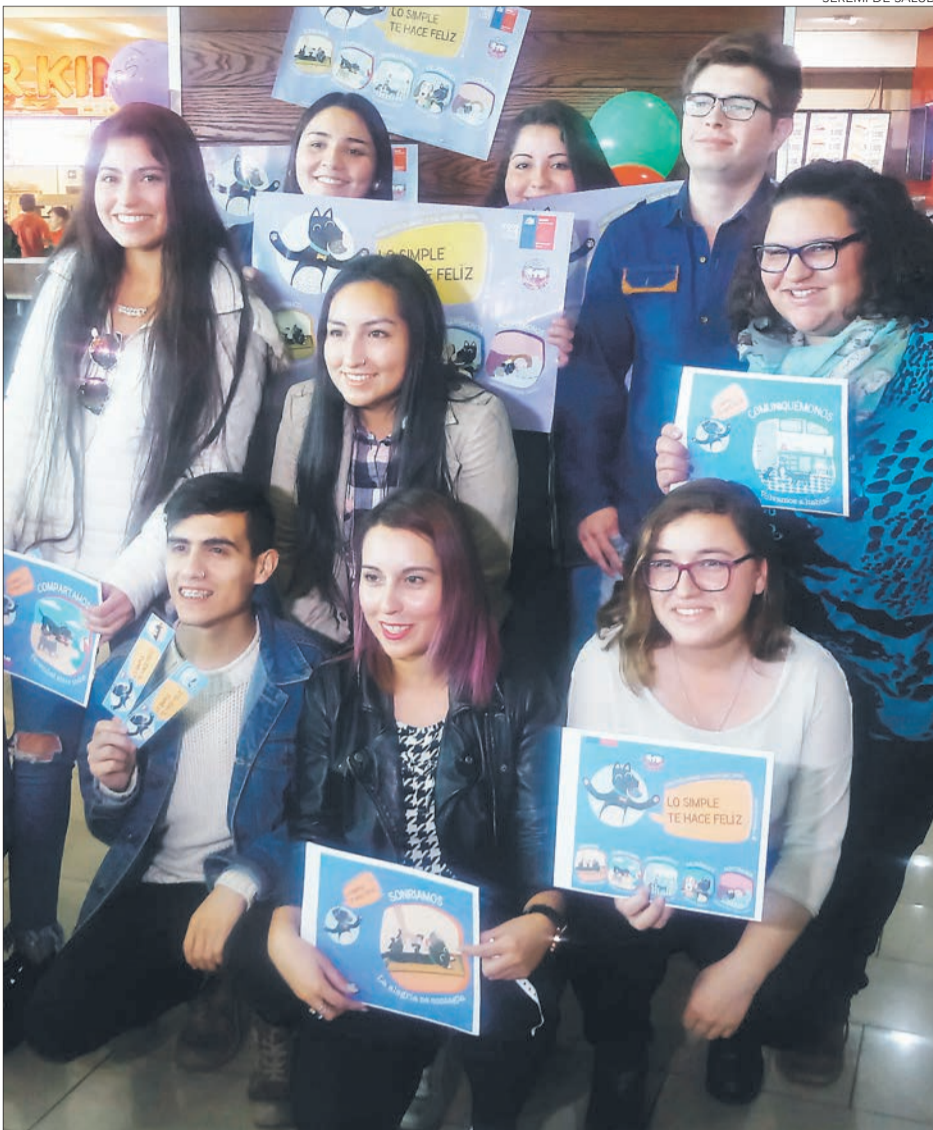
LA CAMPAÑA fue presentada en el Mall del Centro.