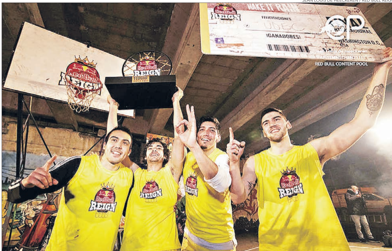
CONJUNTO local clasificó a esta final tras ganar la eliminatoria nacional, en julio pasado.