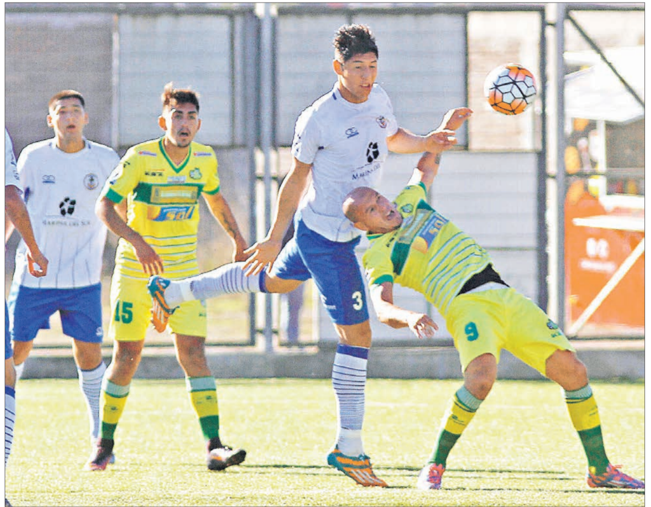
EL ANCLA ratificó el buen nivel que ha mostrado en las últimas fechas del campeonato.

bien, pero este empate fastidió más a los choreros que al dueño de casa. Es que Naval hizo un muy buen partido en