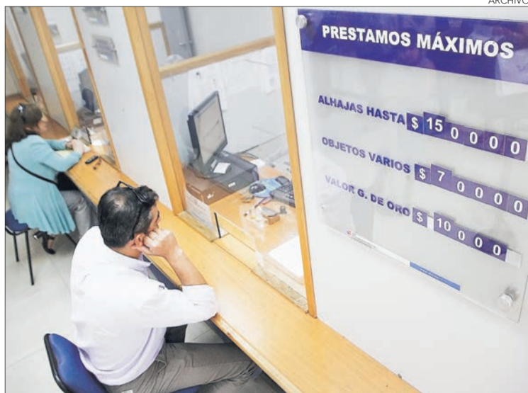
CERCA DE 40 mil personas por año acceden al crédito prendario en Bío Bío.

Daniel Núñez Durán contacto@diarioconcepcion.cl