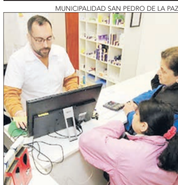
MUNICIPALIDAD SAN PEDRO DE LA PAZ

Ciclovías y paso peatonal. Permitirá conectar el casco urbano y el parque Ecuador con el río Bío Bío.