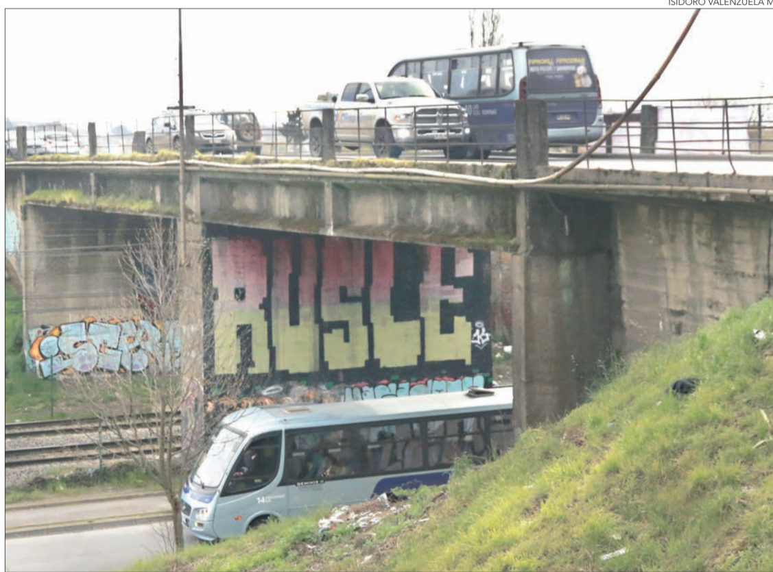
ISIDORO VALENZUELA M.

Diseño del proyecto estará listo el primer semestre del próximo año. Se invertirán $16.000 millones.