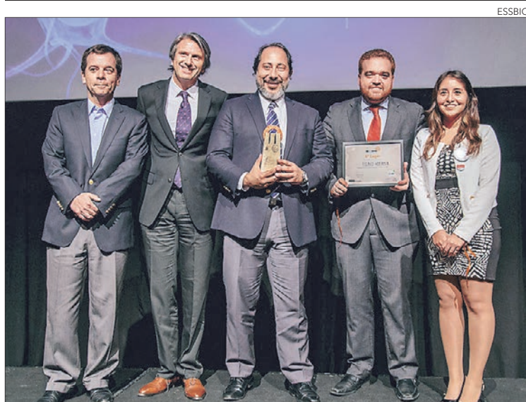
LA PLANA MAYOR recibiendo este importante reconocimiento.

Twitter @DiarioConce contacto@diarioconcepcion.cl