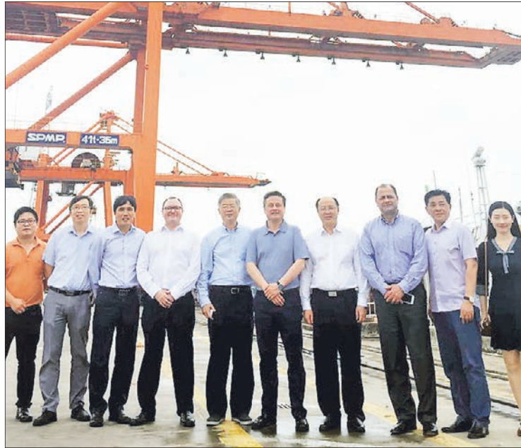
LOS INTEGRANTES DE LA delegación que por estos días recorre China para fortalecer lazos.