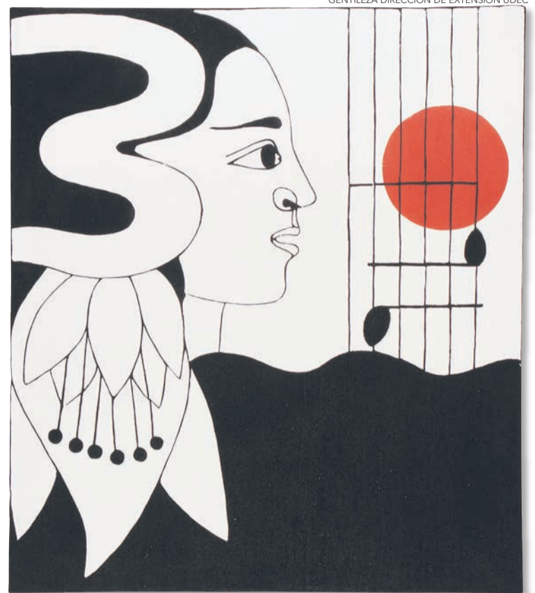
MUESTRA INCLUYE 85 grabados del autor nacido en Canihual provincia de Arauco.