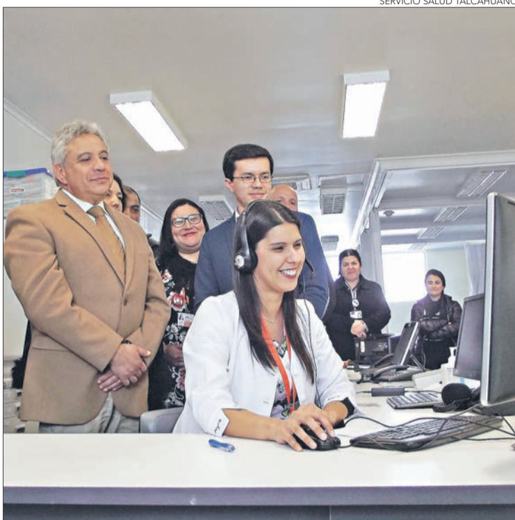
SERVICIO SALUD TALCAHUANO