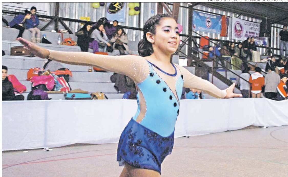
PATINAJE ARTÍSTICO PROVINCIA DE CONCEPCIÓN

Entre las numerosas participantes, destaca la presencia de una importante delegación enviada desde la provincia de Concepción. Se trata de 15 patinadoras del Club Skating Queens (agrupación deportiva de Penco, que está a cargo