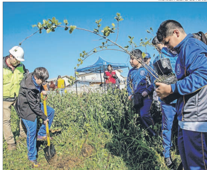
MUNICIPALIDAD DE PENCO

Cesfam Hualpencillo, destacó que desde la inauguración del SAR en mayo han realizado más de 14 mil atenciones lo que significa más de 17% de consultas que en 2016 y, afirmó que en traumatología la teleasistencia será vital, pues totalizan el 30% de las consultas que atienden a diario.