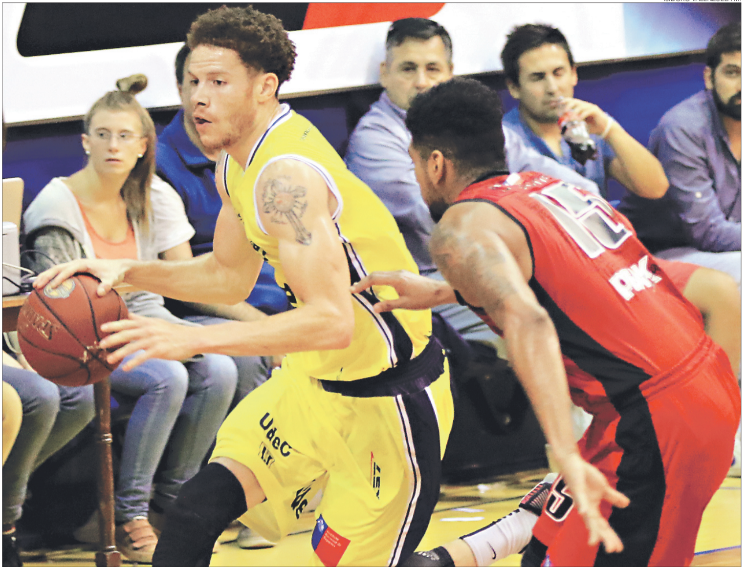
TORNEO FRATERNIDAD EN LA CASA DEL DEPORTE

Como una gran instancia de preparación, de cara a la próxima Liga Nacional de Básquetbol, toman en la UdeC a disputa de este torneo, considerando que ya tiene al grueso de su plantel de cara