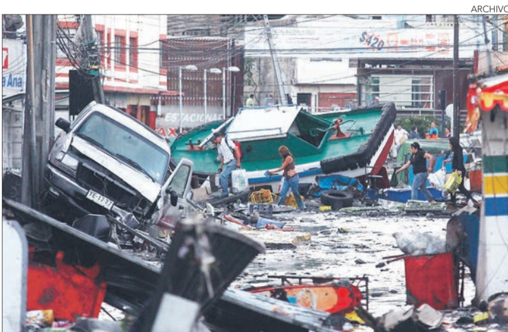
LA INDEMNIZACIÓN es para el esposo y los hijos de la víctima.