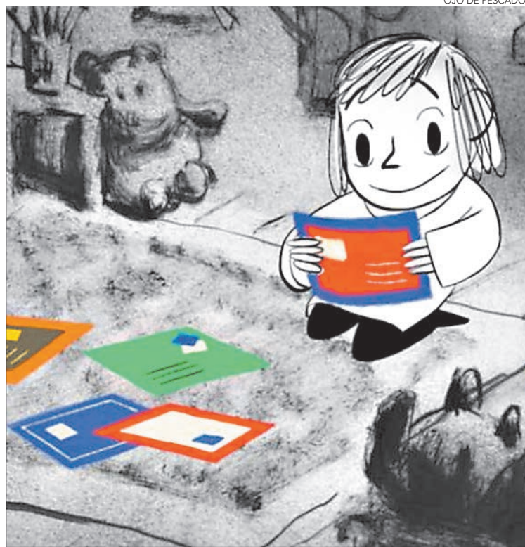
OJO DE PESCADO

Twitter @DiarioConce contacto@diarioconcepcion.cl