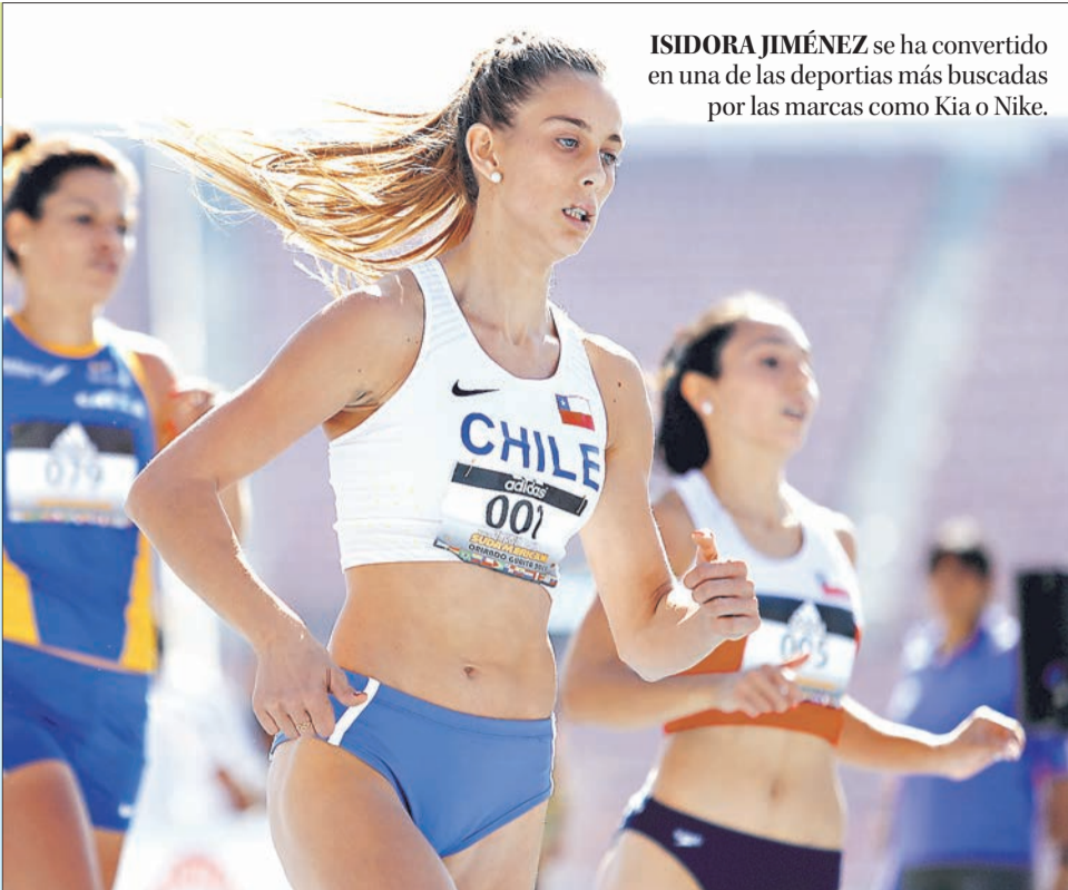
ISIDORA JIMÉNEZ se ha convertido en una de las deportistas más buscadas por las marcas como Kia o Nike.