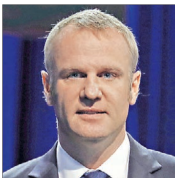
FELIPE KAST. De Santiago a La Araucanía, aunque antes quiso llegar a la Presidencia de la República.