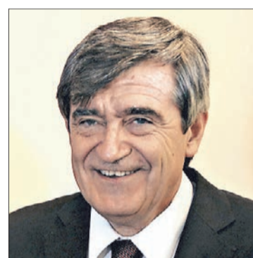
CAMILO ESCALONA. Fue diputado en Lota, senador en Los Lagos y ahora apunta a Aysén.