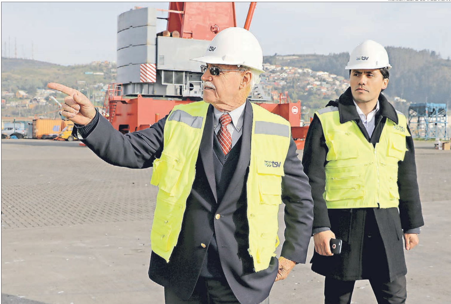
MUNICIPALIDAD DE TALCAHUANO

Entre los aspectos a mejorar, según el asesor internacional, desta-