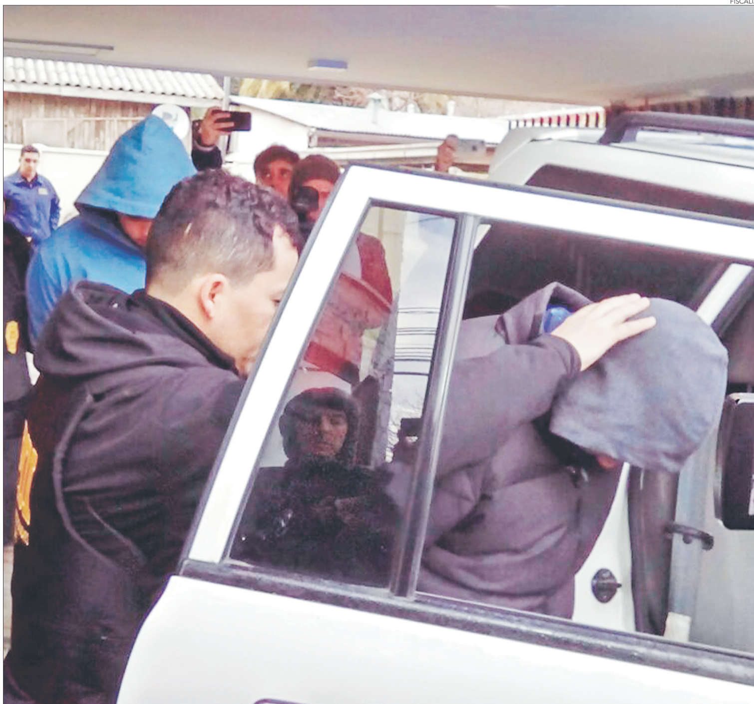
TRABAJO JUNTO A CARABINEROS Y PDI

En el trabajo con equipos policiales exclusivos para las labores