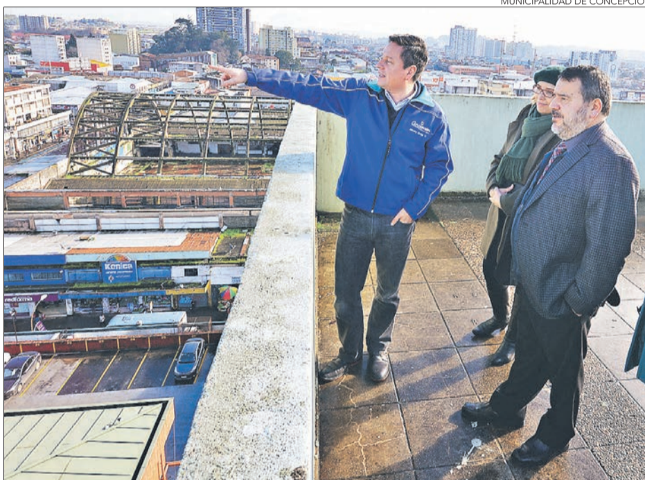
MUNICIPALIDAD DE CONCEPCIÓN

El proyecto busca poder canalizar las ideas de los municipios para poder concretarlas en hitos de inversiones mayores.