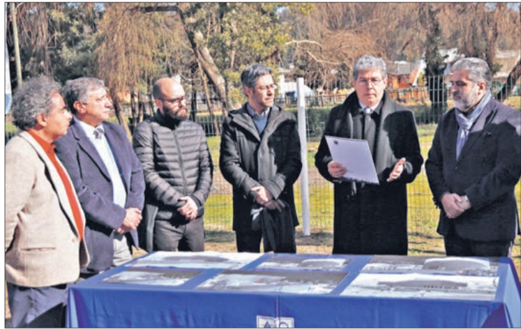
RECTOR UBB y el Pdte. de los Cores muestran certificado del proyecto.