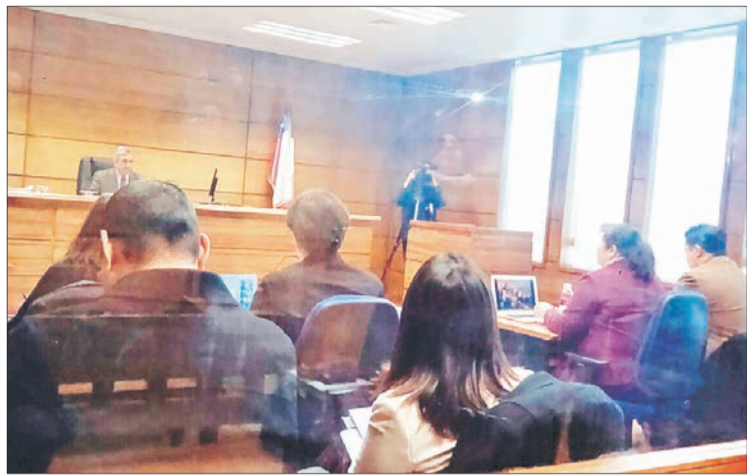
LA FISCALÍA formalizó por dos delitos a los ejecutivos.