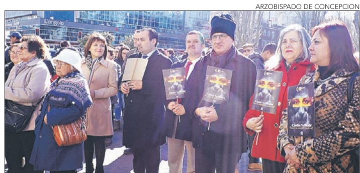
LAS ACTIVIDADES se extenderán durante todo agosto.

La Galería de la Historia de Concepción suma más de sesenta mil visitantes al año, y fue inaugurada en 1983. Más información en www.ghconcepcion.cl