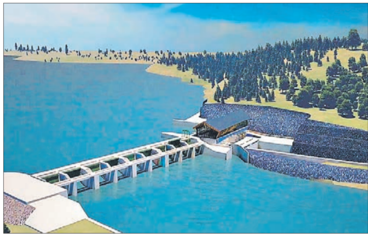
EL PROYECTO hidroeléctrico Frontera cuenta ya con RCA favorable.