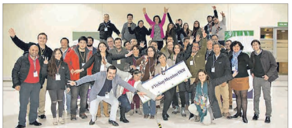
EL EQUIPO DE MENTORES Y LOS EMPRENDEDORES tras la jornada del cuarto BMU.