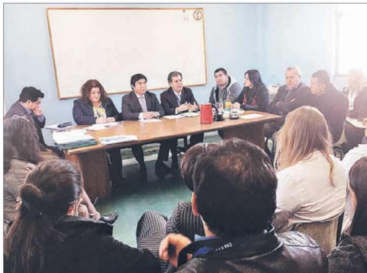
LOS FUNCIONARIOS paralizaron ayer por unas horas debido al ataque.

Twitter @DiarioConce contacto@diarioconcepcion.cl