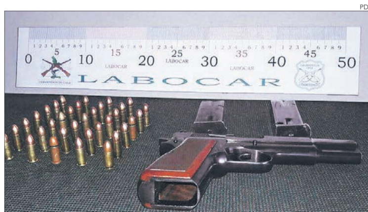
El armamento había sido sustraído en junio en Concepción.