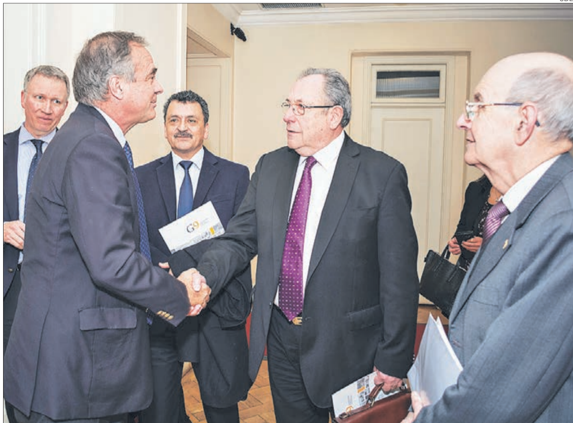
LOS RECIBIERON LOS SENADORES IGNACIO WALKER Y ANDRÉS ZALDIVAR