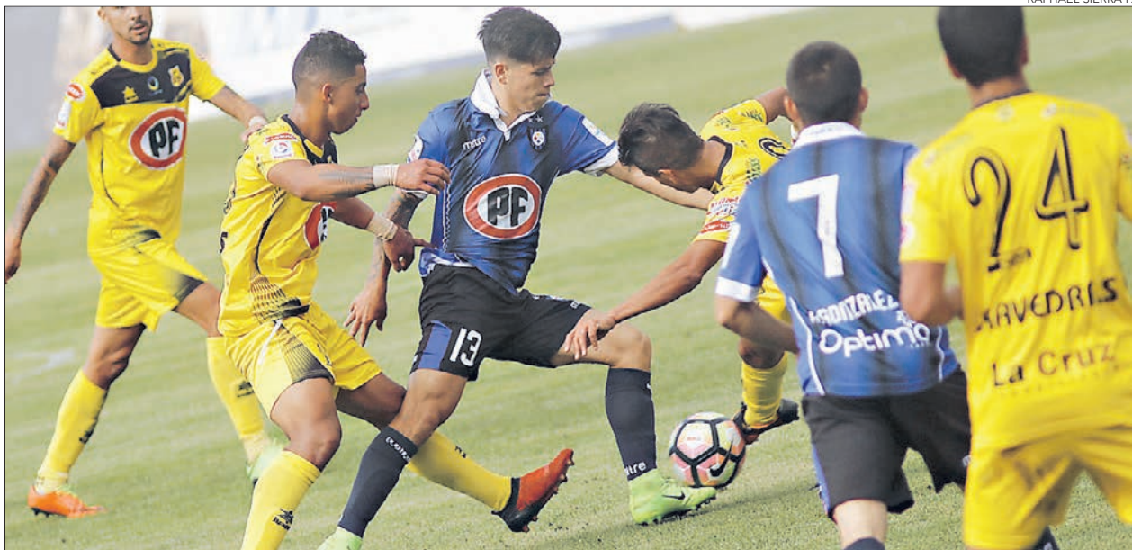
EN EL SINTÉTICO de Quillota debutará Huachipato en el Torneo de Transición.

Tras un buen rendimiento en la Copa Chile, en el acero esperan sostener el nivel con miras al encuentro de hoy. Podrá contar con Valber Huerta.