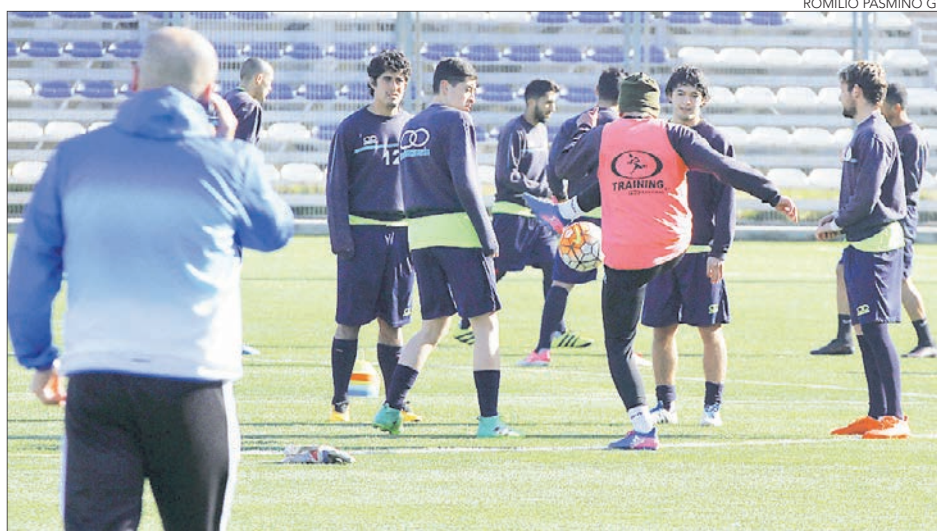
UNA ESPERANZADORA práctica tuvo el plantel de Naval en El Morro.

Días difíciles tuvo en las últimas semanas Naval de Talcahuano. Los problemas administrativos los habían dejado sin fútbol activo durante este segundo semestre, producto del no pago a tiempo de la garantía de 30 millones de pesos exigidos para participar de la Segunda División Profesional.