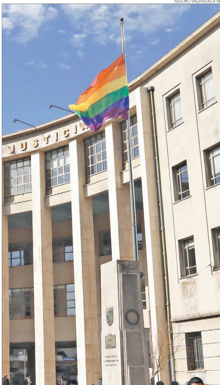
MUNICIPIO DENUNCIÓ DELITO A CARABINEROS