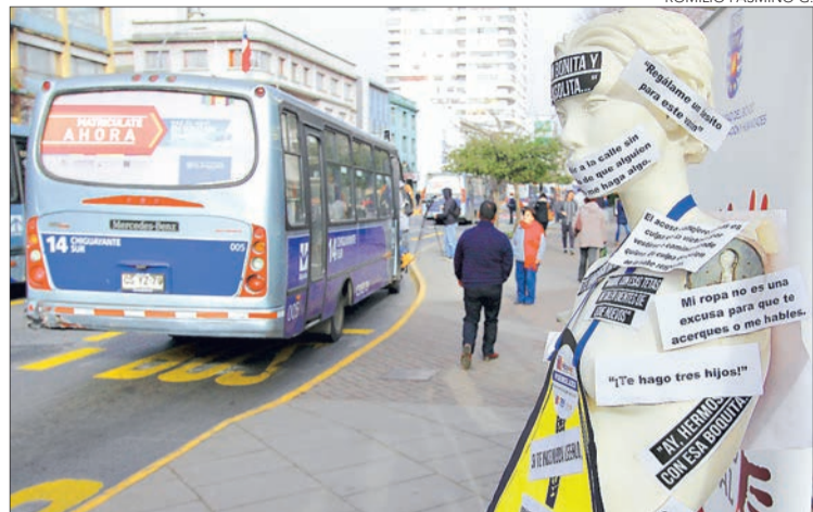
LA ACCIÓN SE REALIZÓ en O'Higgins frente a Tribunales.