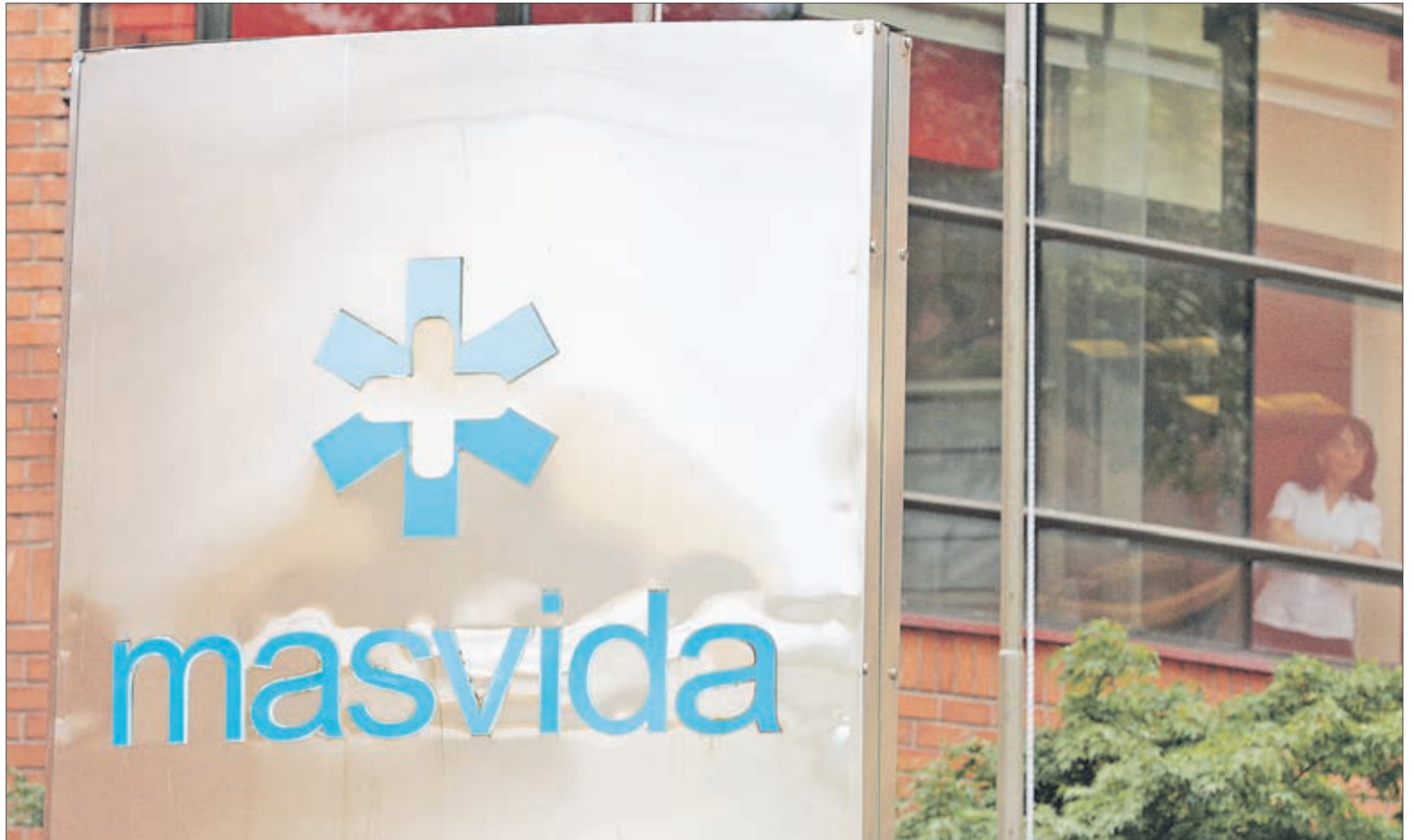
NUEVA MASVIDA arrienda el emblemático inmueble en avenida O'Higgins, hoy embargado.