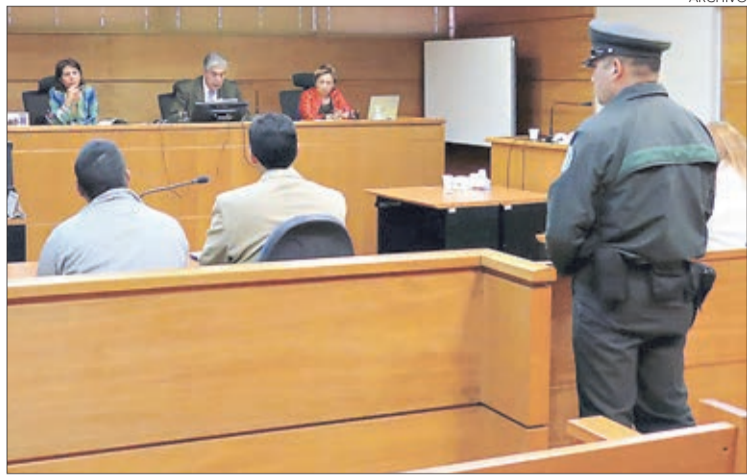
EL TRIBUNAL ORAL en lo penal había aceptado el agravante.