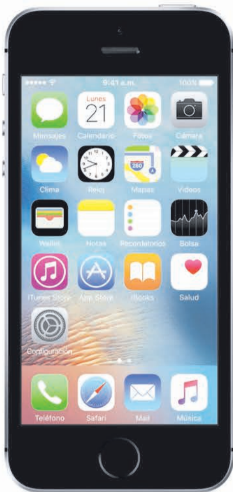
Apple iPhone SE

LLÉVALO CON 12 CUOTAS DE : $4.990 Cuota inicial: $59.880 Costo total: $349.900 CAE 1,46%