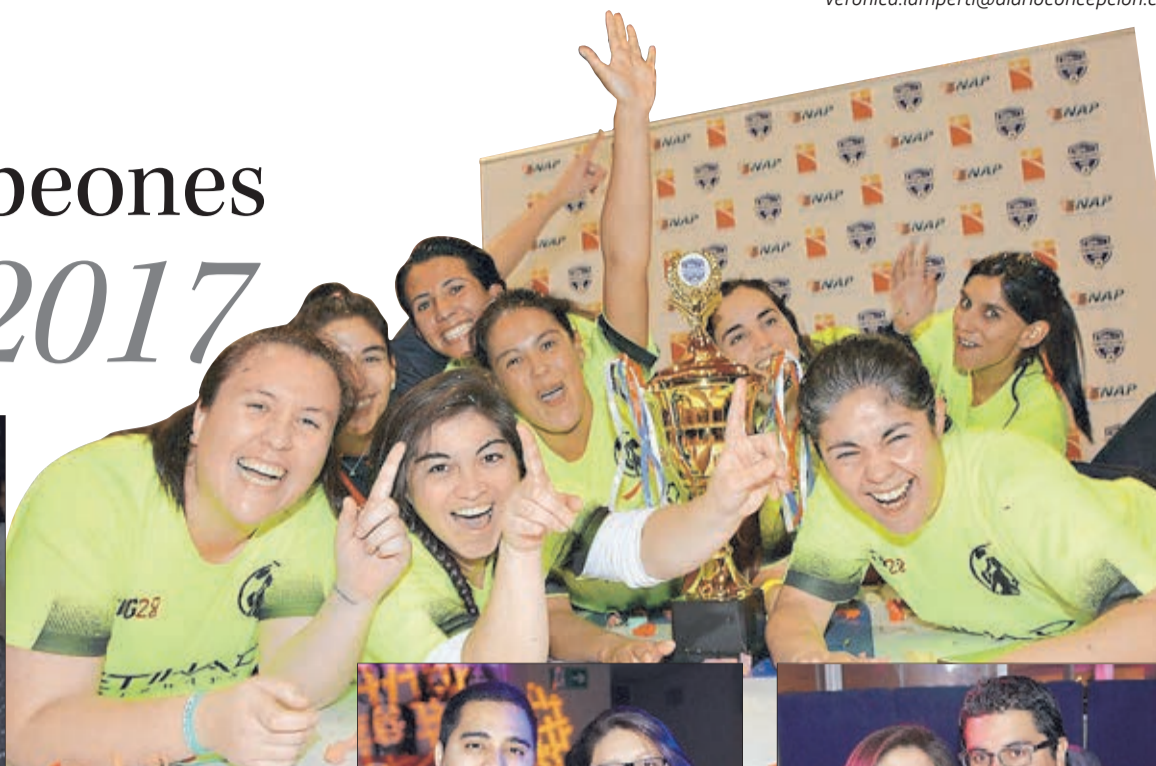
REPRESENTANTES DE DIARIO CONCEPCIÓN, equipo ganador del torneo.