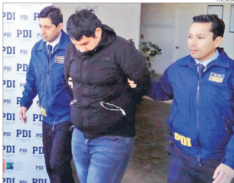
EL HOMBRE FUE detenido tras las pericias realizadas por la PDI.