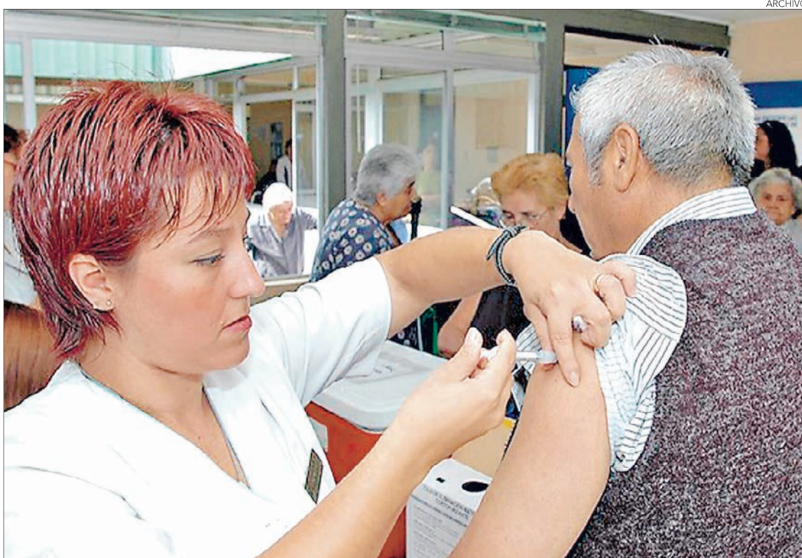
TRABAJADORES AVÍCOLAS Y agrícolas lideraron en la protección entregada en forma gratuita.

“Hubo 4.327 rechazos en la Región, con un porcentaje que alcan-