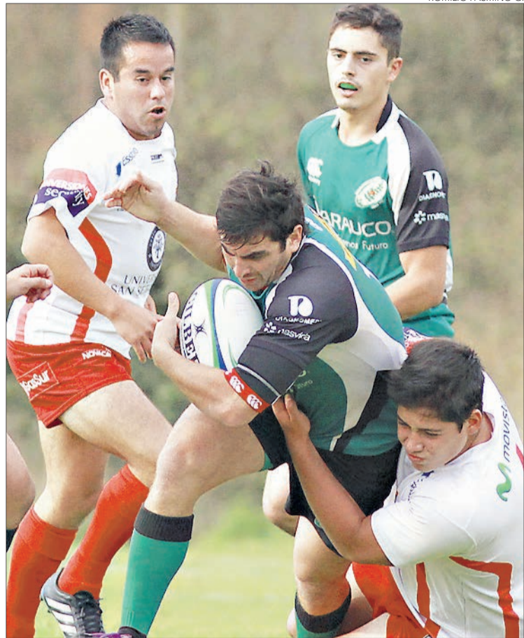
MIENTRAS TRONCOS jugará en condición de visita, Old John's tendrá su segundo encuentro consecutivo como local.

Twitter @DiarioConce contacto@diarioconcepcion.cl