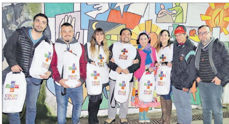
VOLUNTARIOS PARTICIPANTES en la campaña Calor-Color de Gas Sur.