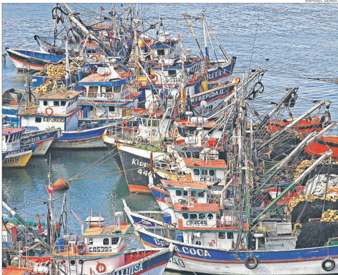
RAPHAEL SIERRA P.

"La superficie aprobada para Obras Nuevas representa el 91,6% del total