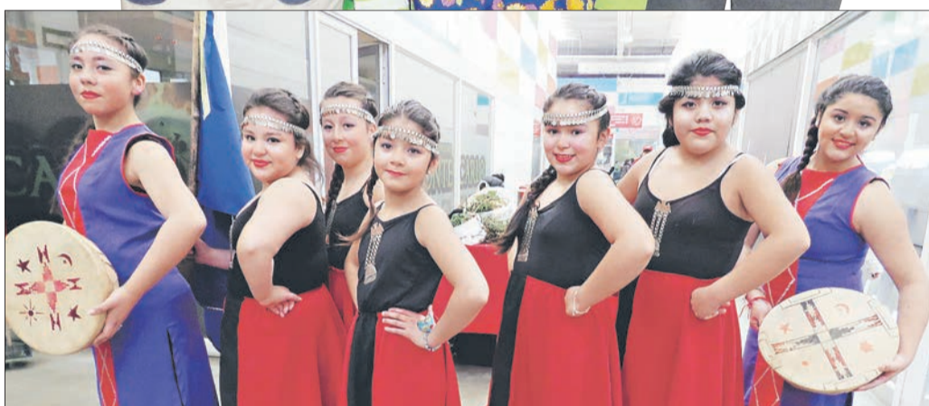
ALUMNAS de la escuela E-970 de Ralco.