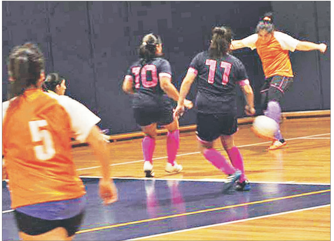
COPA ENAP 2017

Esta noche, se decidirá quién levanta el título en damas, con Diario Concepción como primera opción para adjudicarse el título,