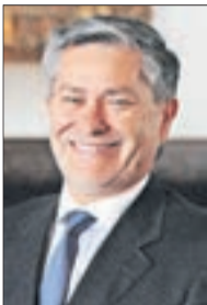
Iván Valenzuela Díaz, seremi de Economía.

Entre las características de un empresario, está el espíritu creativo, la capacidad para asumir riesgos, la determinación en las decisiones, pasión por la empresa, espí-