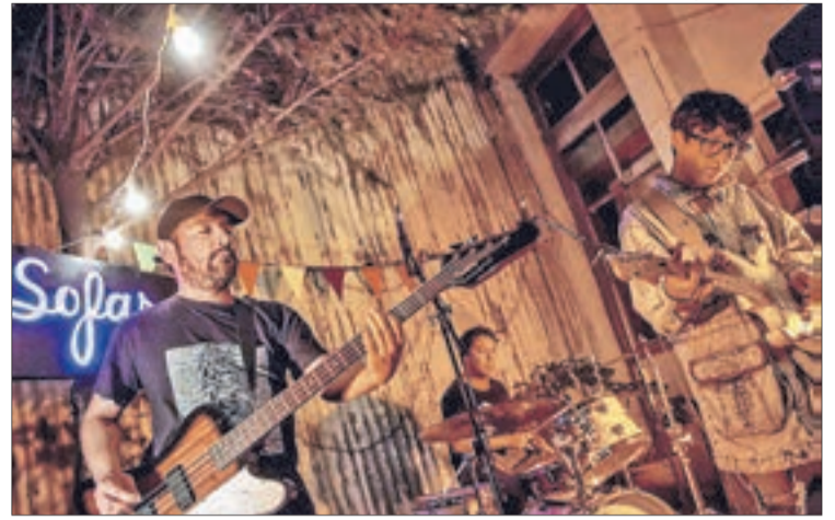
ADOLESCENTES SIN EDAD es una de las bandas incluidas en el disco.