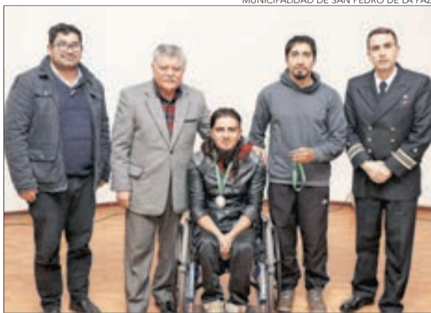
MUNICIPALIDAD DE SAN PEDRO DE LA PAZ

Hasta ahora, no estaba formalizada la forma para ocupar la Laguna, y el convenio establece los deberes y derechos que poseen las organizaciones deportivas náuticas, además de las medidas de seguridad que deben conocer para el buen uso de