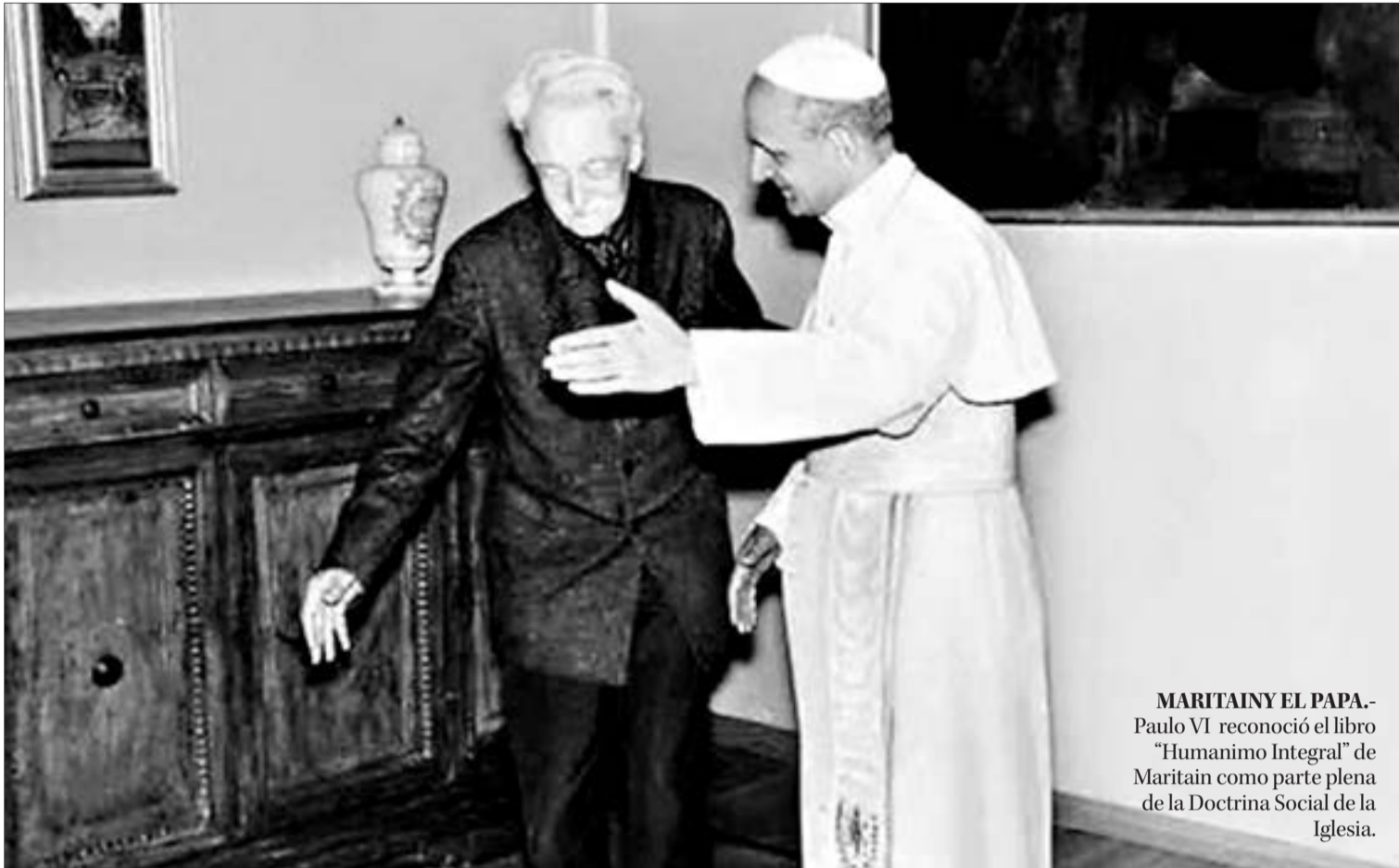
MARITAIN Y EL PAPA. — Paulo VI reconoció el libro “Humanismo Integral” de Maritain como parte plena de la Doctrina Social de la Iglesia.

El solo diálogo racional, objetivo y democrático constituye una amenaza contra la integración de la colectividad porque pone de manifiesto eventuales tensiones y conflictos que podrían dañar la concordia interna. El otro es visto como lo extraño, cuando no como algo hostil que desafía a la ortodoxia. En el otro, lo mestizo, lo contaminado y degradado, radican siempre las culpas políticas. De la promiscuidad con lo otro arrancan las desviaciones que inducen a cometer errores, los que deben ser corregidos para salvar la pureza original de la organización. El integrismo es una distopía que, como el huevo de la serpiente, deja