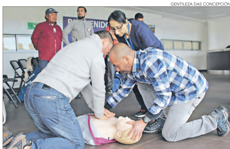
ACTIVIDAD trató uso de desfibriladores y reanimación.

Twitter @DiarioConce contacto@diarioconcepcion.cl