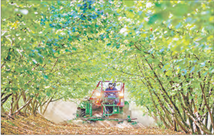
Alianza público-privada garantiza apoyo técnico a los agricultores.