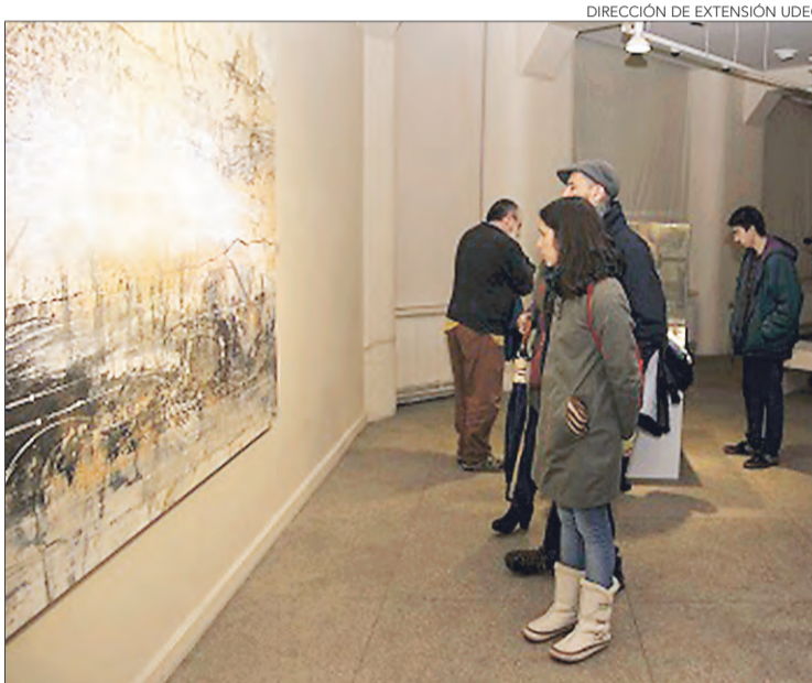
DIRECCIÓN DE EXTENSIÓN UDEC

Pintor pertenece a la primera generación de estudiantes de Artes Visuales de la UdeC.