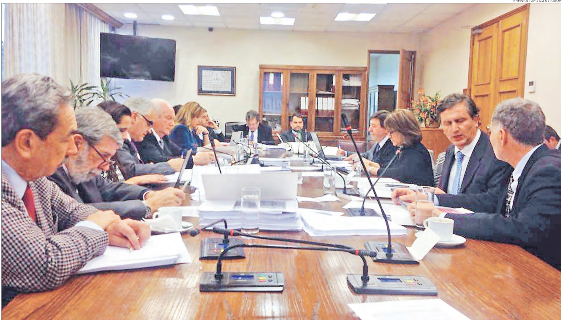
PRENSA DIPUTADO SABAG

Ángel Rogel Álvarez angel.rogel@diarioconcepcion.cl