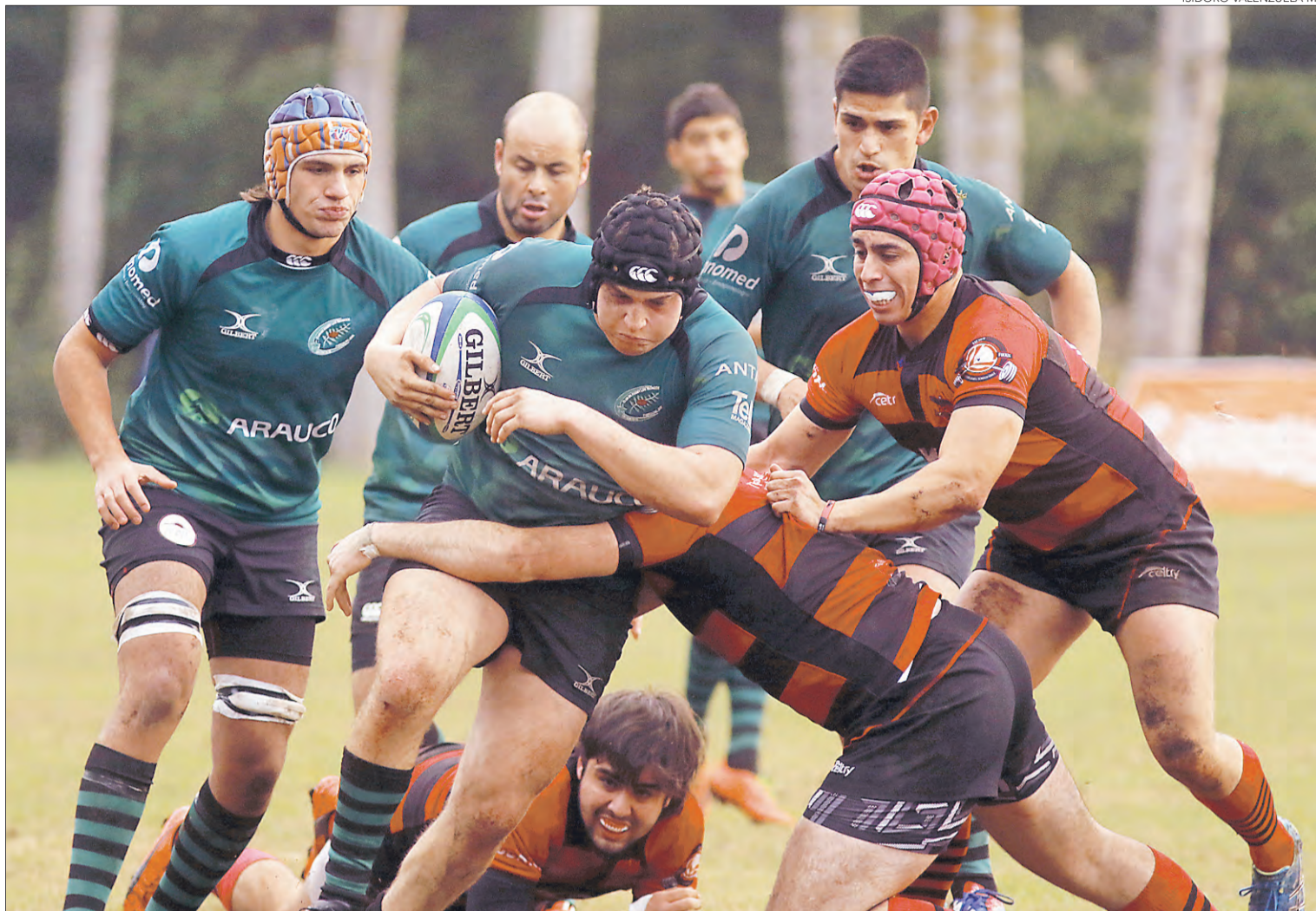
TRONCOS Y SU COMIENZO EN LA LIGA NACIONAL DE RUGBY

"Vamos a ir a ganar ese partido, si queremos pelear por entrar en semifinales es un rival directo. Igual todavía no entiendo cómo realizaron el fixture del campeonato, porque a nosotros que fuimos segundos el año pasado no está tocando jugar con todos los equipos que quedaron abajo nuestro en condición de visitante. Eso lo hace todo más complicado todavía, pero vamos a seguir luchando, y tengo la impresión que en este partido el