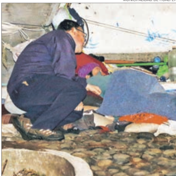
MUNICIPALIDAD DE HUALPEN