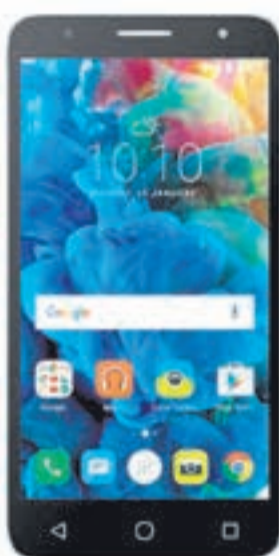
Alcatel POP 4 Plus 5056