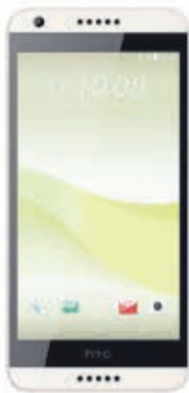
HTC Desire 650