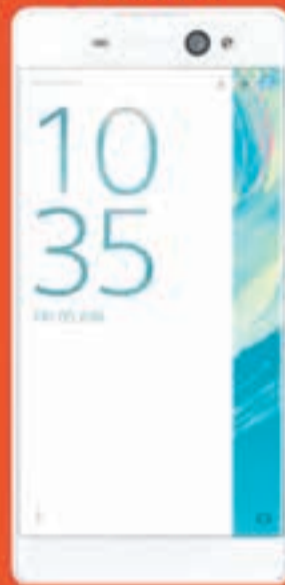
Sony Xperia XA ULTRA