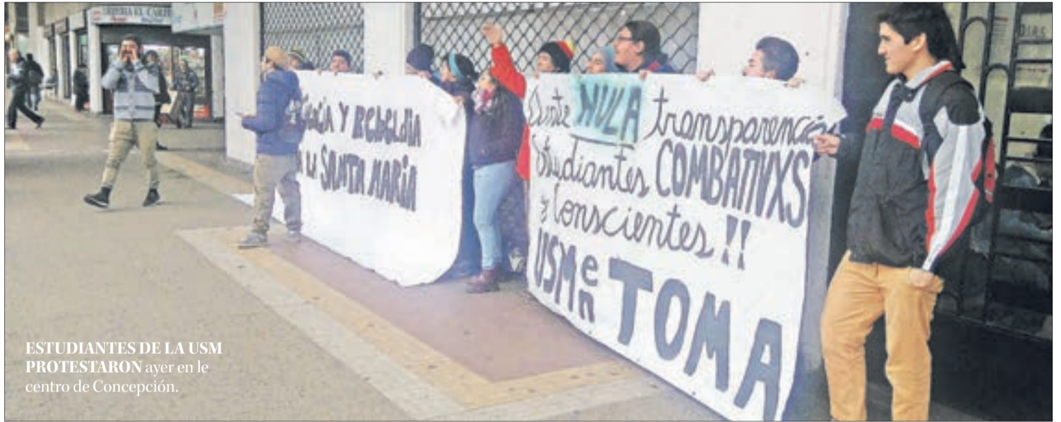
ESTUDIANTES DE LA USM PROTESTARON ayer en el centro de Concepción.

El presidente de la Federación de Estudiantes de la Universidad de Concepción detalló que en el plantel cerca de 15 carreras adhirieron al paro para reflexionar en torno a las demandas. Explicó que a nivel país la respuesta a la petición de los alumnos para terminar con prácticas sexistas ha sido lenta y que las iniciativas existentes han sido levantadas desde el movimiento estudiantil (Solo la UdeC y la Católica de Santiago cuentan con comisiones de género).