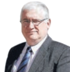
RENATO SEGURA Director Regional de ProChile

El cumplimiento de metas y alcanzar la cumbre del ranking de desempeño, son los resultados habituales que enarbolan quienes acometen la tarea de pavimentar el camino hacia el éxito, la prosperidad y la realización personal.