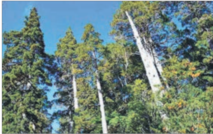
PINOS Y EUCALYPTUS se reemplazarán por plantaciones de bosque nativo.