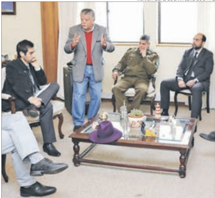
LAS AUTORIDADES evaluaron el plan de la comuna.