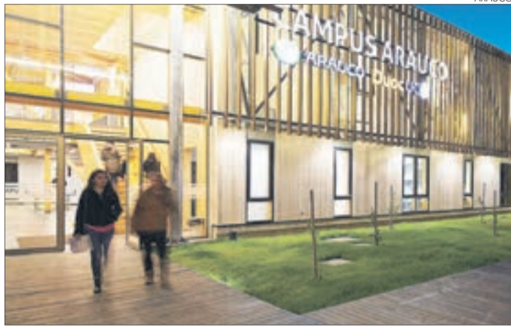
EL DISEÑO ganó la mención "Plata" del "A' Design Award".