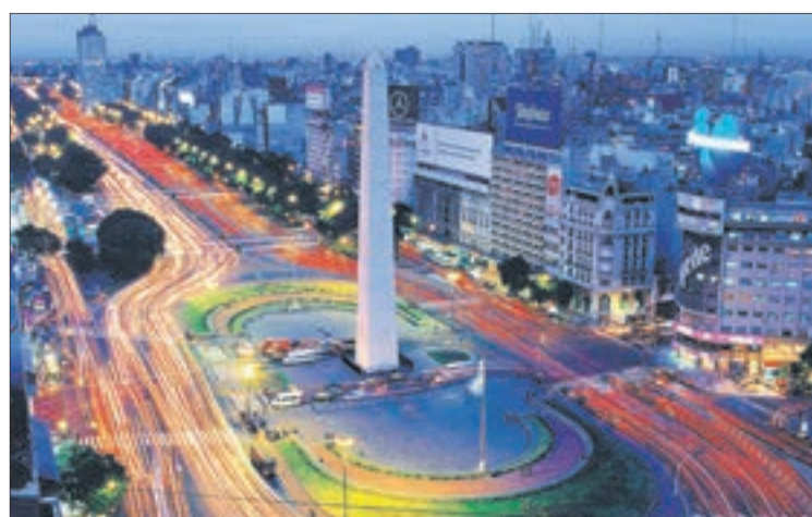
B. AIRES, Río de Janeiro, Lima, Miami y Madrid los destinos preferidos.

Twitter @DiarioConce contacto@diarioconcepcion.cl