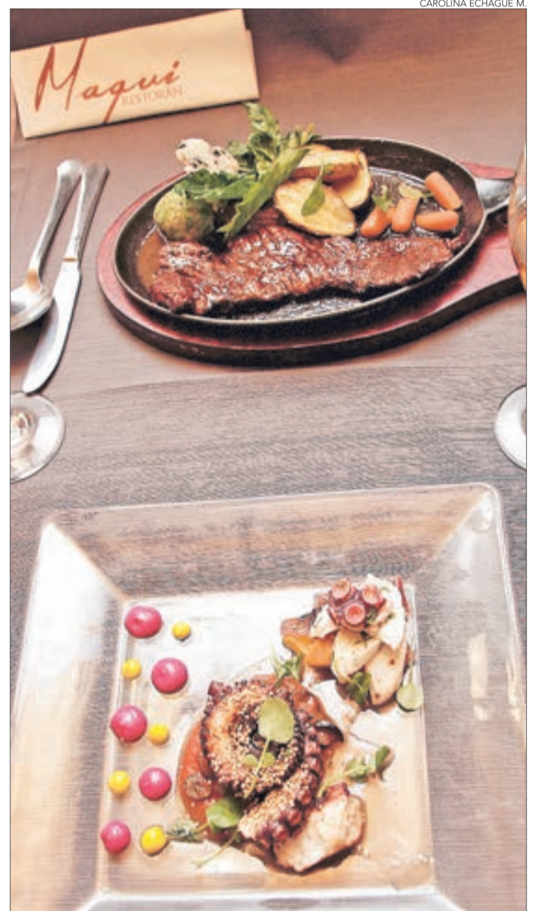
PULPO FRÍO Y CALIENTE EN EL MISMO PLATO. Restorán Maqui posee además sus propios acuarios para trabajar con mariscos.

cias a partir de pasantías en Europa en cocinas españolas, italianas, francesas, suizas, entre otras, del viejo continente. Nuestro enfoque es la comida patrimonial, de recolección y mestiza, inspirado en lugares de la Región del Bío Bío y con la influencia de 15 países que he tenido la suerte de visitar. El objetivo es incorporar productos de recolección tales como el changle, la murtilla, avellanas, piñones y productos costeros como pescados, mariscos y algas para lograr mestizaje de gastronomía chilena con la del mundo".