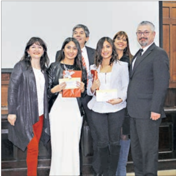
EGRESADOS APOYAN a nuevos estudiantes con aporte monetario.

FACULTAD CIENCIAS JURÍDICAS Y SOCIALES UDEC