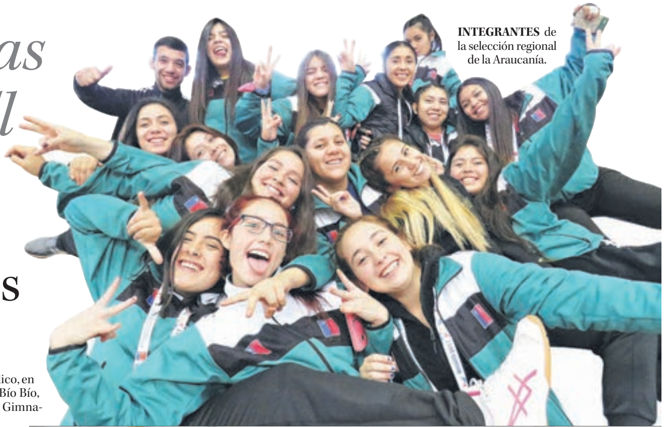
INTEGRANTES de la selección regional de la Araucanía.

Uno de los deportes que más llamó la atención del público, en el marco de los Juegos Nacionales y Paranaconales del Bío Bío, fue el Campeonato Femenino de Handball, realizado en el Gimnasio Municipal de Concepción.