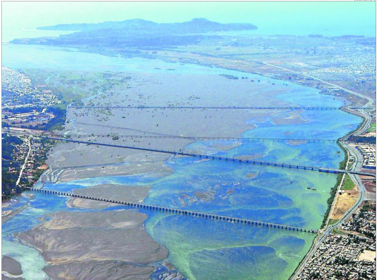
JOSÉ LENIZ G.

Proyectos priorizados 2016 - 2017 para Bío Bío bordean los US$ 2 mil millones. El sector busca agilizar concesiones, un nuevo subsidio y renovar la agenda de crecimiento.