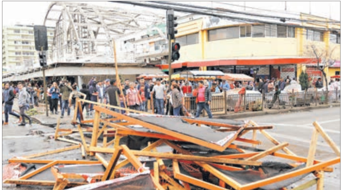
LOS AMBULANTES cortaron las calles e instalaron barricadas.

La protesta fue protagonizada por vendedores ilegales que ocupan el sector en rechazo a una intervención de Carabineros en todo el perímetro de calle Caupolicán.