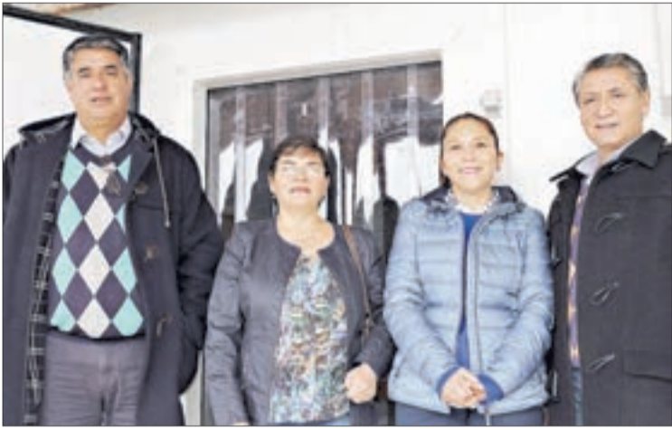
PEQUEÑOS EMPRESARIOS se asocian para aumentar su competitividad.