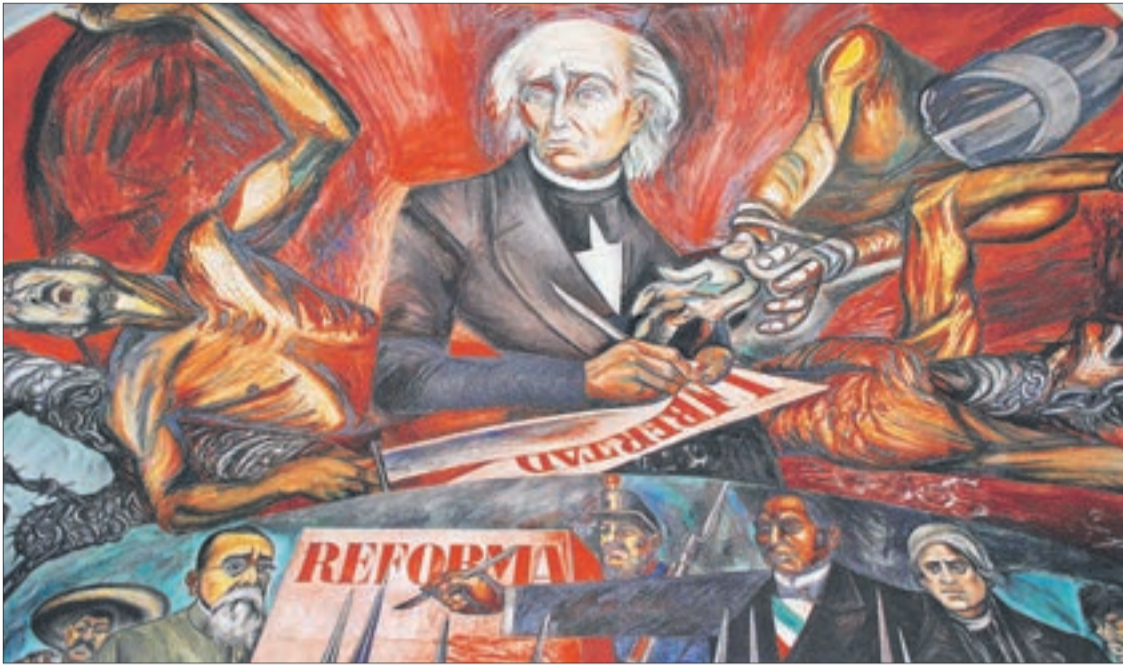
EXPOSICIÓN "MURALES MEXICANOS"