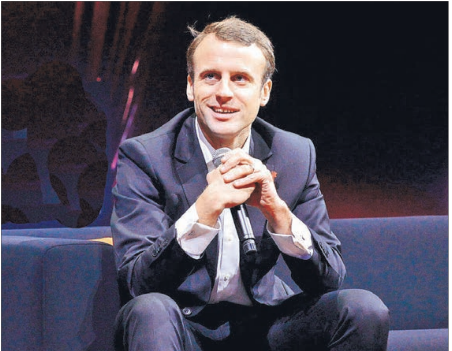
EMMANUEL MACRON, el flamante presidente electo de Francia, se impuso con un 66% de los votos sobre la ultraderecha (33%). Pero no tiene la tarea fácil.

“Hay que ver si Macron logra mayoría en la asamblea. Como es probable que no obtenga la mitad más uno, va a tener que formar alianzas para nombrar un primer ministro y un gobierno de confianza y así evitar la cohabitación política, que es cuando tienen colores políticos distintos el presidente, el primer ministro y el Gobierno”, completa la analista, quien subraya el hecho de que, al igual que en las presidenciales, en las próximas parlamentarias el voto de apoyo a Emma-