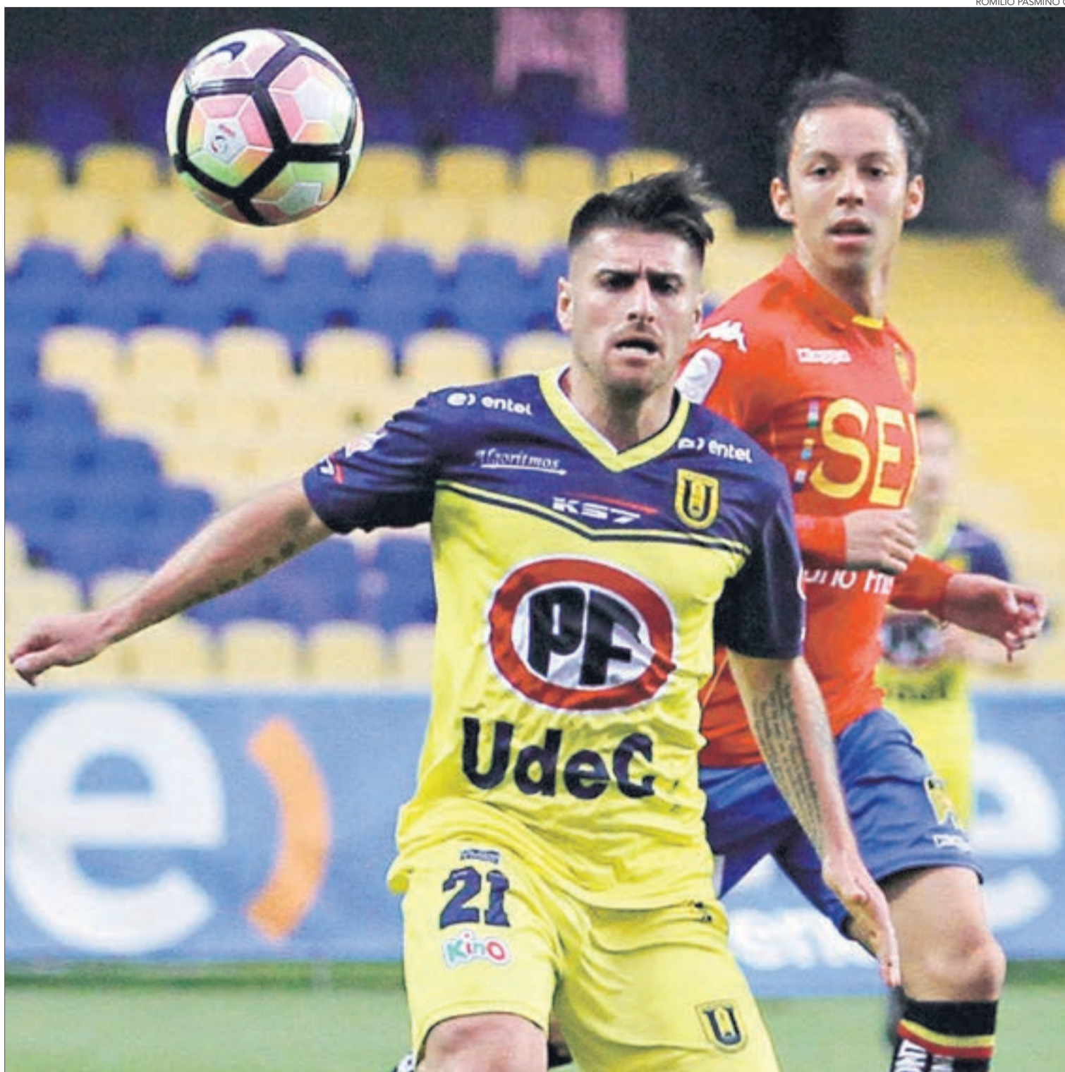
UDEC IGUALÓ CON UNIÓN ESPAÑOLA EN EL ESTER ROA

En el reinicio se mantuvo la tónica, mucho roce, harta interrupción y poco juego. A los 49', la