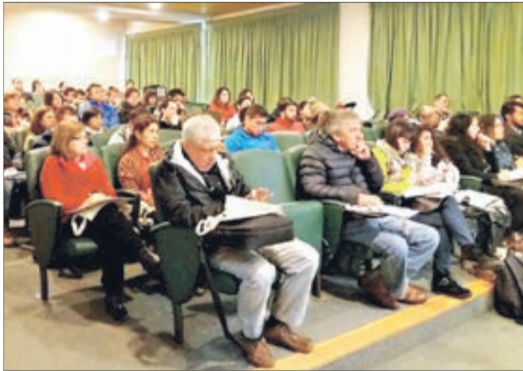
CERCA DE 70 asistentes en la primera actividad convocada por el Centro.