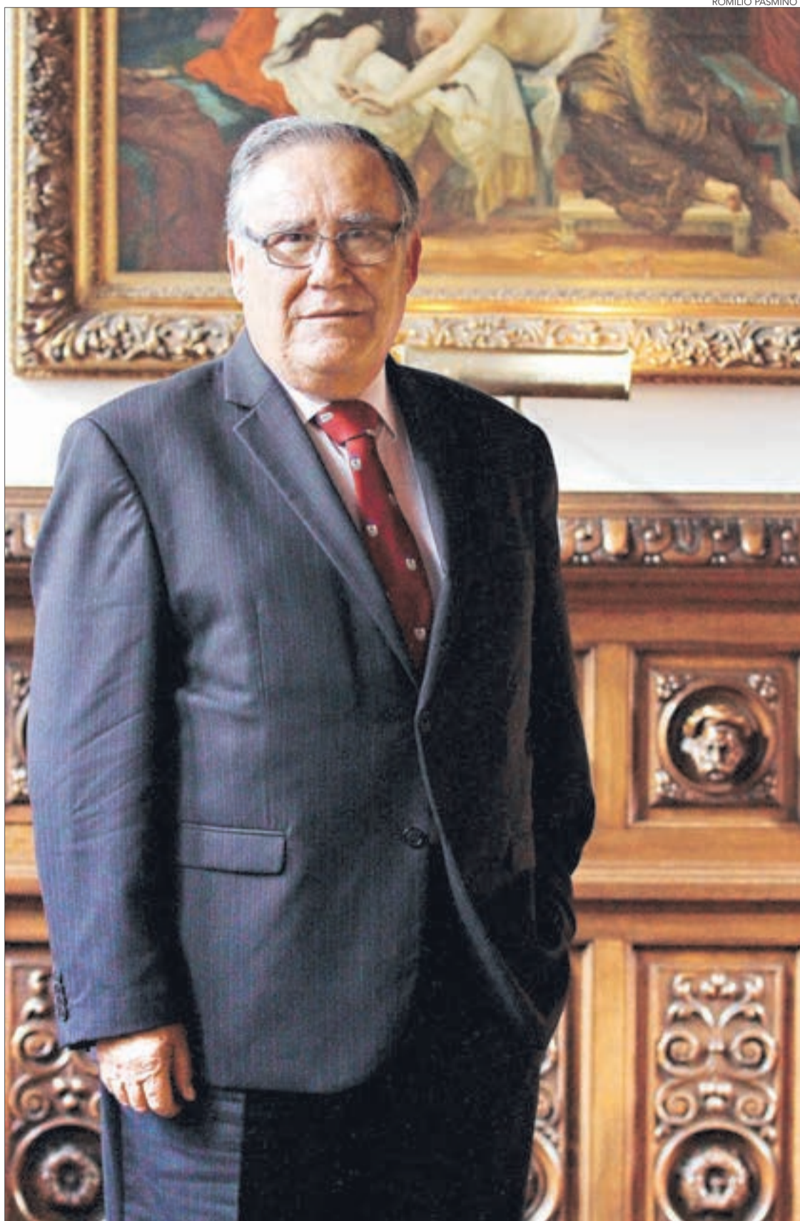
JAIME CAMPOS, MINISTRO DE JUSTICIA:

- El esfuerzo que hemos hecho por sacar al ministerio y sus servicios de los conflictos. Éramos titulares en los medios todos los días, por los problemas de Registro Civil, Sename y Gendarmería, donde se aplicaron las medidas correctivas que correspondían. En el primer caso, en toda la controversia de la conformación del padrón electoral, que hasta ponían en riesgo la legitimidad de las elecciones municipales, se hicieron las investigaciones, las auditorías, encontramos las fallas y hoy podemos decir que el padrón está prefecto y enfrentaremos confiados las próximas elecciones. En Sename, después de tantos años, ya hemos enviado el proyecto 8 proyectos de ley que le cambian completamente la política de menores en Chile, porque estamos convencidos que el sistema actual de menores está colapsado. Y recibí Gendarmería con