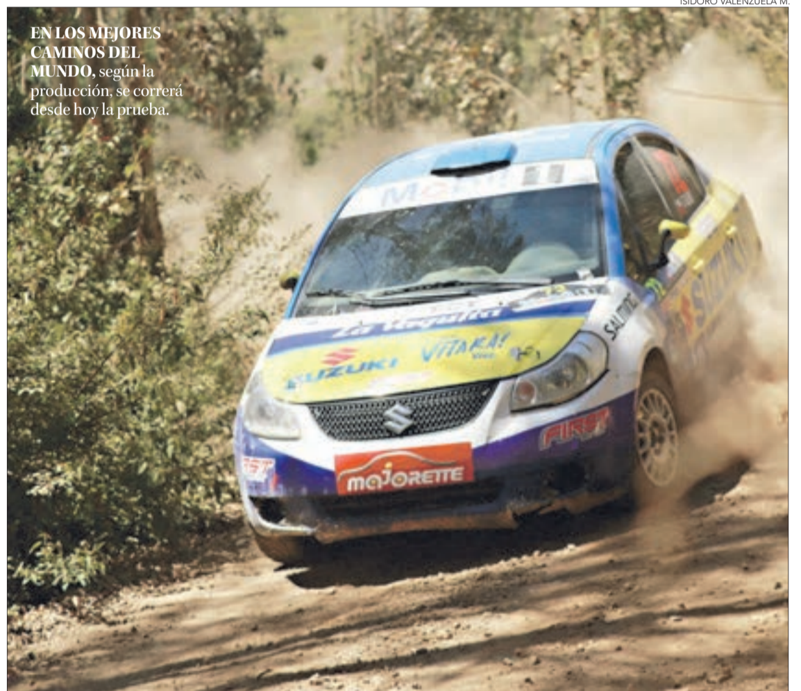
ISIDORO VALENZUELA M.

Hoy se inicia la competencia que comprende 12 pruebas en 575,1 kilómetros, con presencia de 40 binomios.