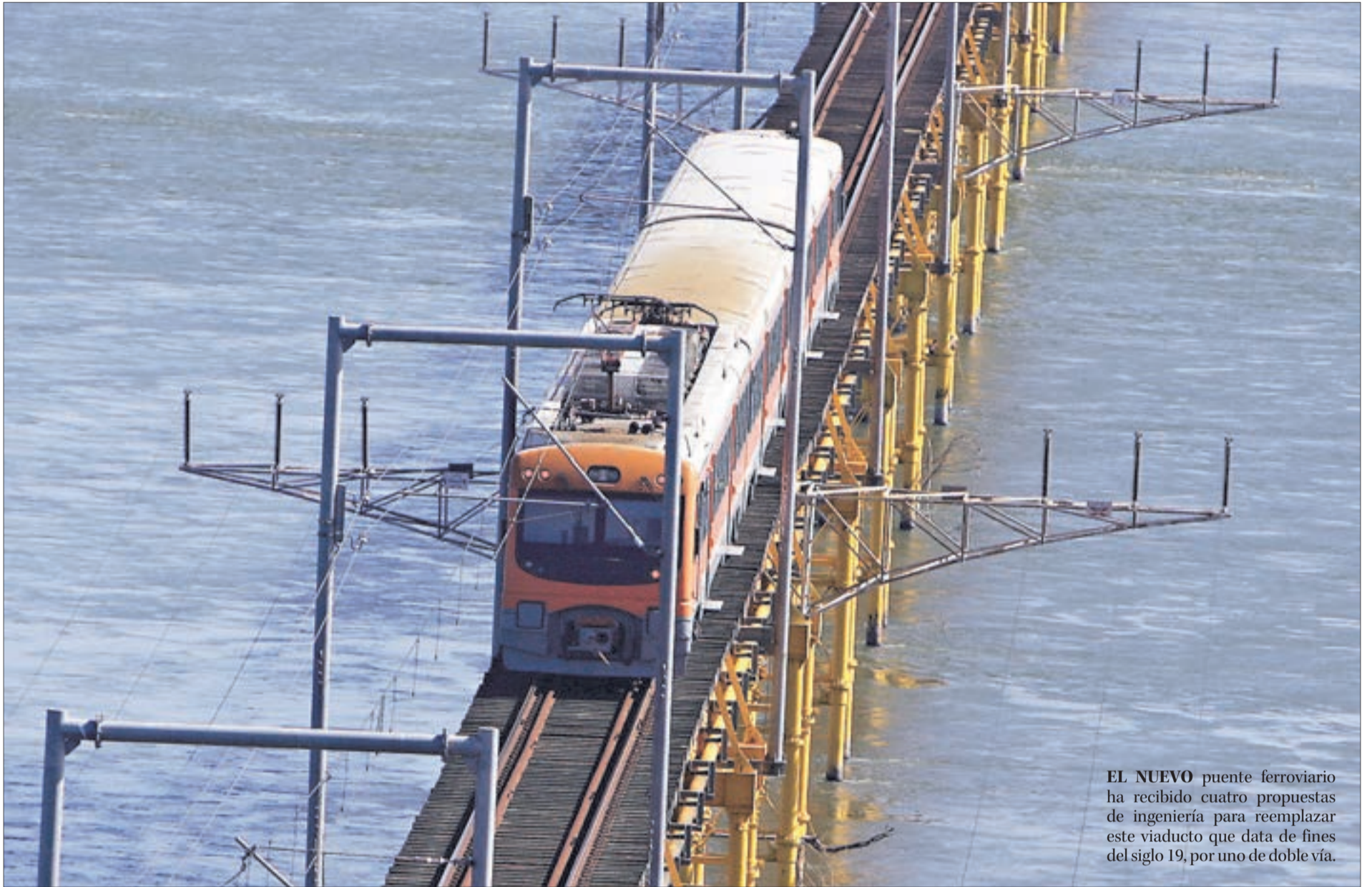
EL NUEVO puente ferroviario ha recibido cuatro propuestas de ingeniería para reemplazar este viaducto que data de fines del siglo 19, por uno de doble vía.

SE MANTIENE UN EBITDA NEGATIVO, PERO LA TASA DE PÉRDIDA POR PASAJERO HA IDO A LA BAJA GRACIAS A LA DEMANDA