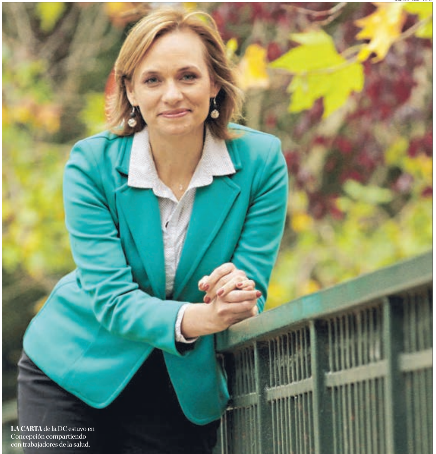
LA CARTA de la DC estuvo en Concepción compartiendo con trabajadores de la salud.

Consultada al respecto y aunque prefirió no ahondar, sí envió un mensaje a los partidos de La Nueva Mayoría que se han abierto a la posibilidad de conversar con el PRO, léase el PC y el PPD. “Me llama la atención que con los primeros que conversan, sean con los que más han criticado lo que hemos hecho”.