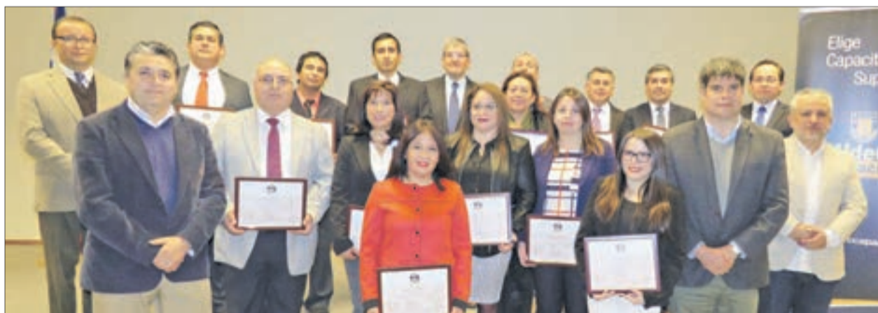
CEREMONIA DE TITULACIÓN de UdeC Capacita.