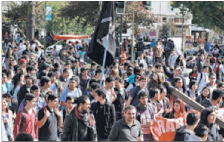
MARCHARÁN en la antesala de una nueva jornada de debate de la Reforma.