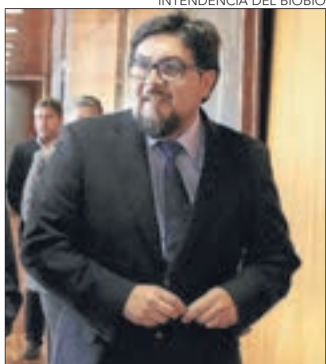
INTENDENCIA DEL BIOBIO