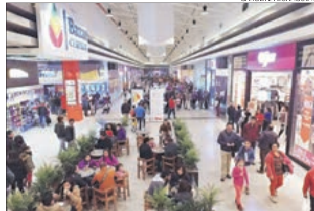
MALL DE CORONEL busca impulsar las ventas con su primera edición de un día con descuentos de hasta 50%.