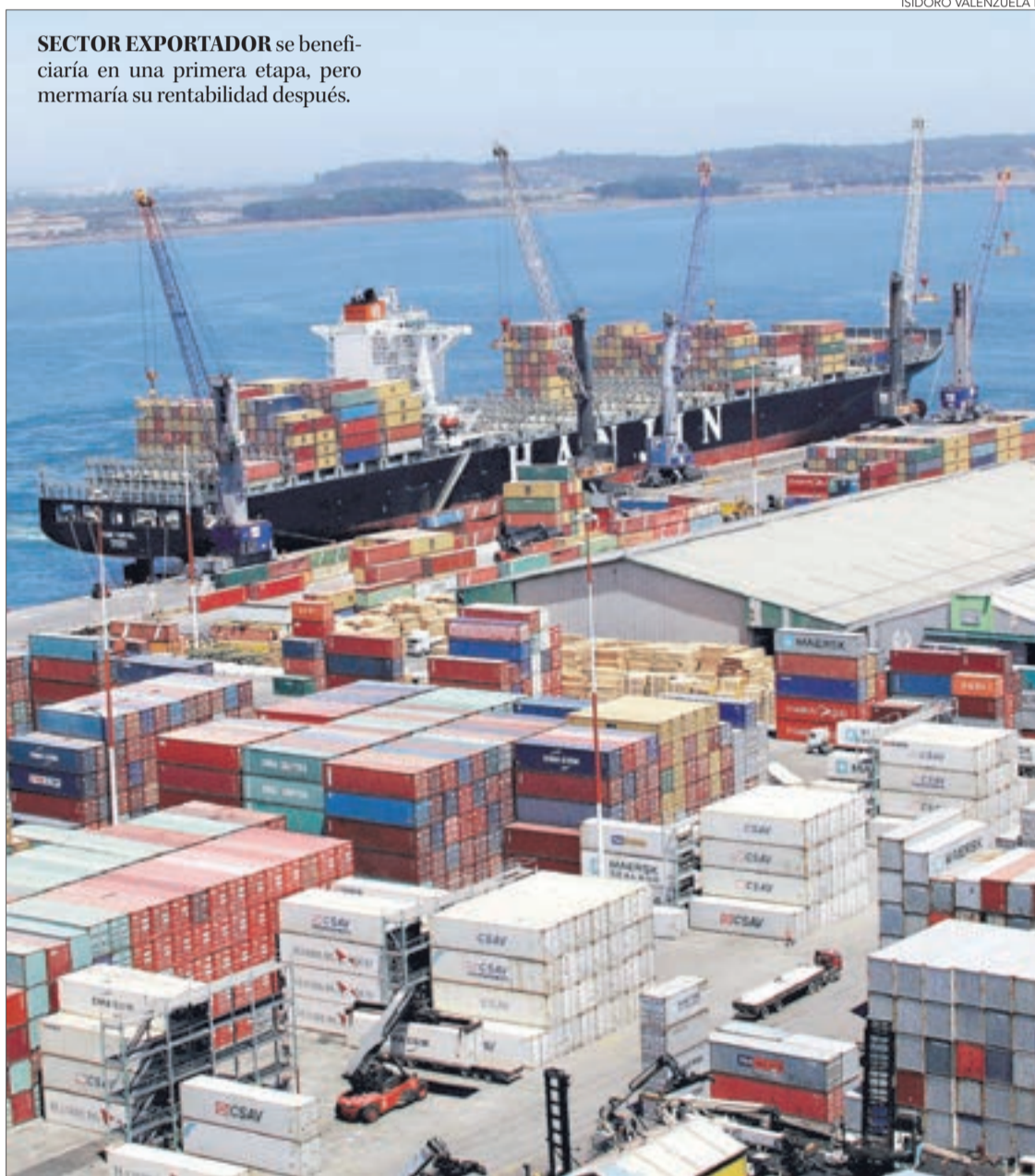
SECTOR EXPORTADOR se beneficiaría en una primera etapa, pero mermaría su rentabilidad después.

De prosperar la medida de Trump se espera que inicialmente suba el precio del dólar, lo que beneficiará a los exportadores, pero posteriormente volvería a bajar en el largo plazo, disminuyendo la competitividad a nivel local y nacional.