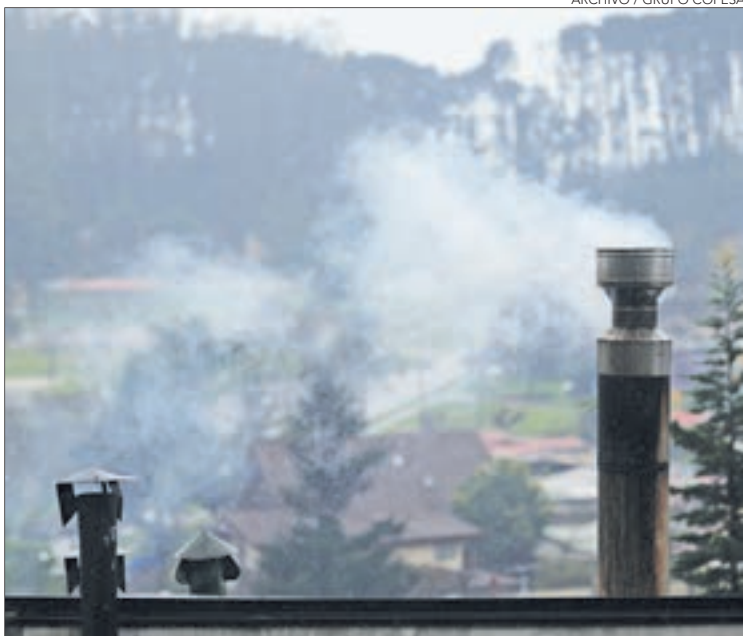
SE PROHIBEN QUEMAS y cualquier acción que contamine.

Establecimientos de Larga Estadía para Adultos Mayores, educacionales, asistenciales públicos y privados; y los residenciales, industriales y comerciales que utilicen pellet de aserrín como combustible”, dijo.