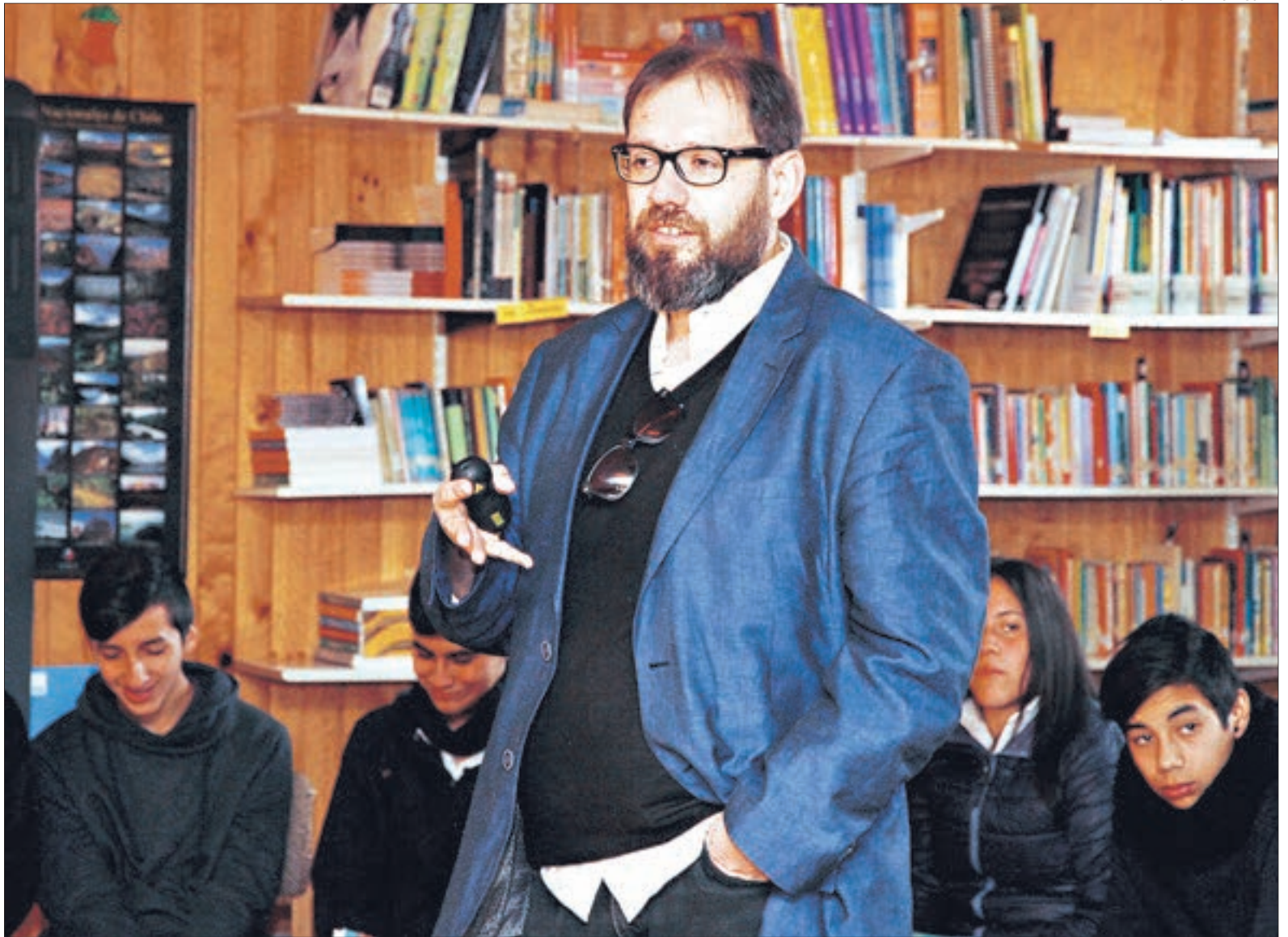
EL ESCRITOR COMPARTIÓ impresiones de su libro "Mocha Dick" con estudiantes de la zona.